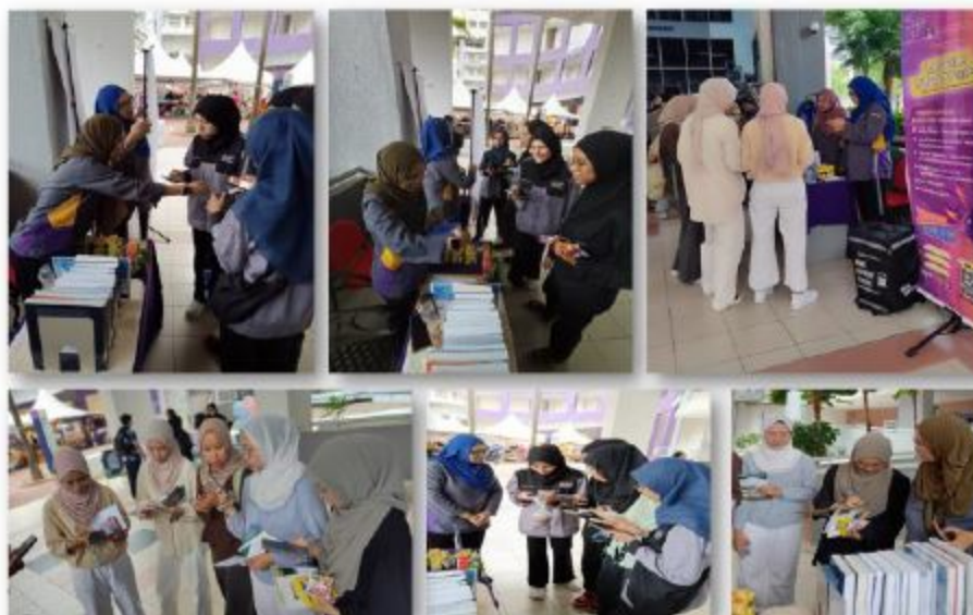
Suasana di sepanjang Program Mobile Library dijalankan