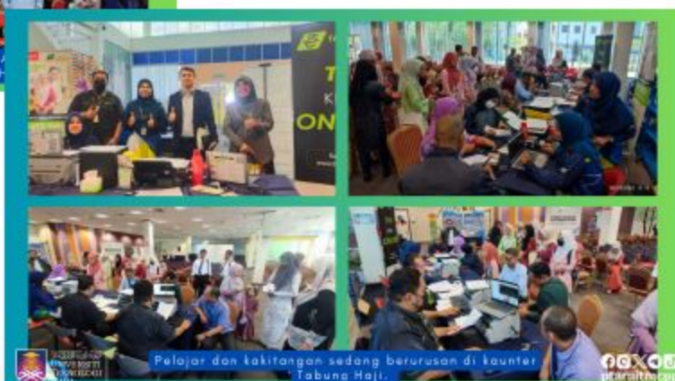
Pelajar dan kakitangan sedang berurusan di kaunter Tabung Haji.