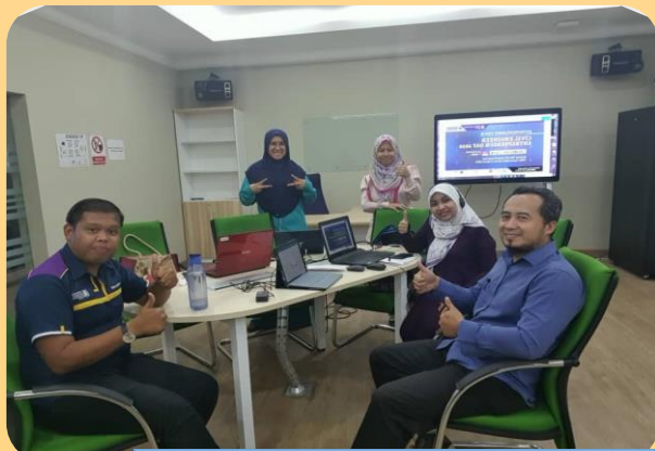
Gambar 2: AJK Di Sebalik Tabir Ketika Program Sedang Berlangsung