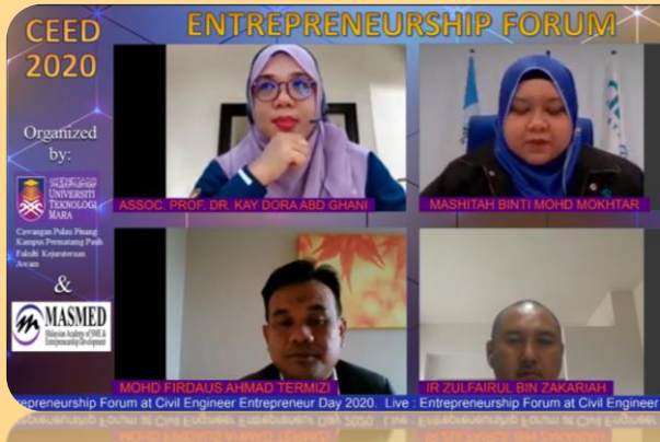
Gambar 1: Moderator Bersama Panel Semasa Sesi Berlangsung

Fakulti Kejuruteraan Awam (FKA) dengan kerjasama Malaysian Academy of SME & Entrepreneurship Development (MASMED) UiTM Cawangan Pulau Pinang telah mengadakan satu siri webinar dan forum berkenaan perniagaan dan keusahawanan dalam bidang industri pembinaan kepada jurutera-jurutera dan pelajar-pelajar tahun akhir Ijazah Sarjana Muda Kejuruteraan Awam (Infrastruktur) (EC221). Program yang bertajuk Civil Engineer Entrepreneur Day (CEED) 2020 ini telah berlangsung selama dua hari iaitu pada 30 November dan 1 Disember 2020 dengan menjemput seramai 10 orang panel (secara bergilir) industri dan alumni UiTM bagi 7 siri Modul. Pada petang hari kedua, satu sesi forum berkenaan keusahawanan dalam bidang kejuruteraan awam telah diadakan sebagai sesi penutup program.