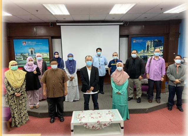
Gambar 3: Bergambar kenangan di akhir program