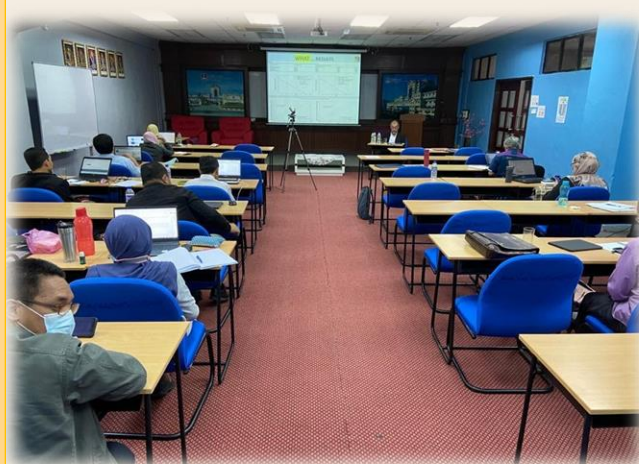
Gambar 2: Ketika sesi bengkel berlangsung