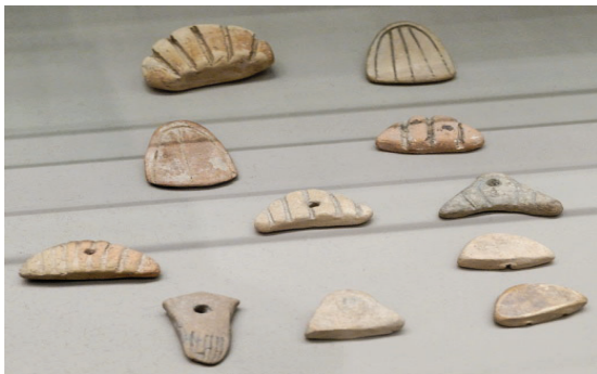
Token Perakaunan dari tanah liat (3,500 S.M.)

Perakaunan merujuk kepada satu sistem lengkap yang merangkumi beberapa proses seperti mengelas, merekod dan merumuskan sesebuah transaksi dan aktiviti perniagaan di dalam bentuk mata wang, serta menterjemahkan hasil dapatan kepada pihak yang berkepentingan bagi membolehkan mereka untuk membuat keputusan perniagaan. Perakaunan juga didefinisikan sebagai satu medium bagi menyampaikan maklumat kewangan sesebuah organisasi yang menjalankan perniagaan kepada pengguna dan pihak yang berkepentingan. Maklumat kewangan yang telah melalui proses pengelasan, rekod dan rumusan akan diterjemahkan di dalam bentuk penyata kewangan. Penyata kewangan ini amat penting bagi pengguna berkepentingan dalam membuat keputusan perniagaan.