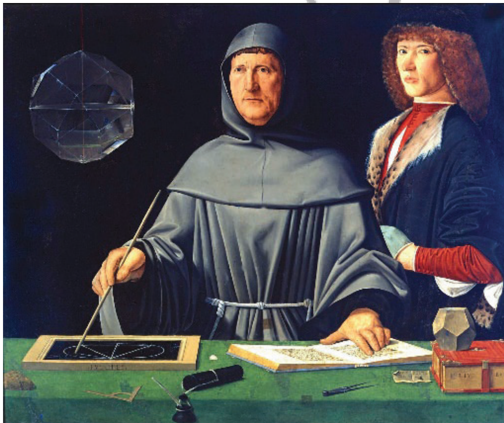
Luca Pacioli, 1495