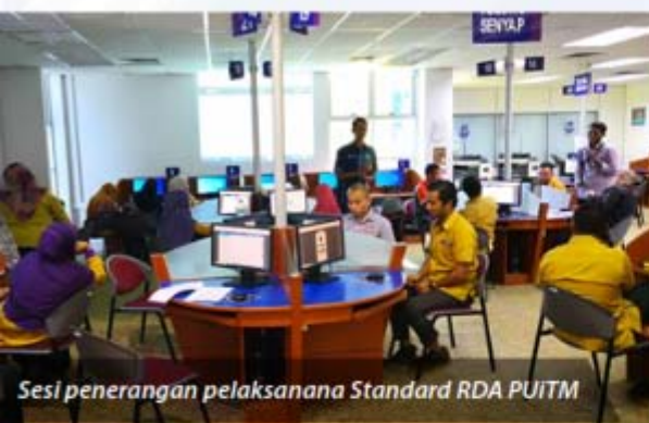
Sesi penerangan pelaksanaan Standard RDA PUITM