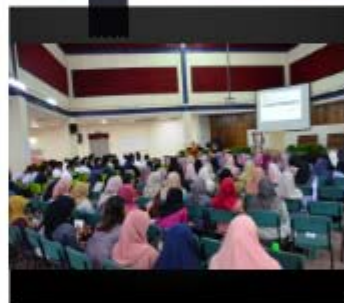
Sesi: Taklimat mengenai PTDI dan Scavenger Hunt

Satu sesi taklimat perpustakaan kepada pelajar interim telah diadakan di Dewan Sri Perla dengan kehadiran seramai 142 orang pelajar. Bagi memastikan taklimat ini lebih berkesan, aktiviti scavenger hunt dilaksanakan dengan pelbagai pengisian berkaitan perkhidmatan dan kemudahan perpustakaan.