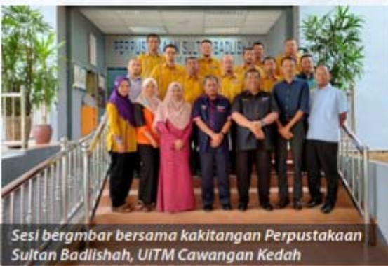
Sesi bergambar bersama kakitangan Perpustakaan Sultan Badlishah, UITM Cawangan Kedah

Lokasi : Perpustakaan Sultan Badlishah, UITM Cawangan Kedah