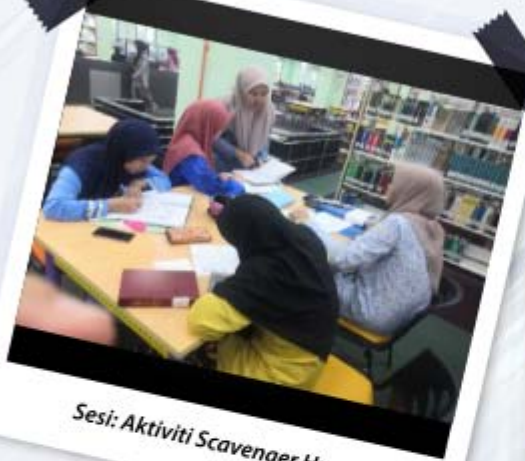
Sesi: Aktiviti Scavenger Hunt