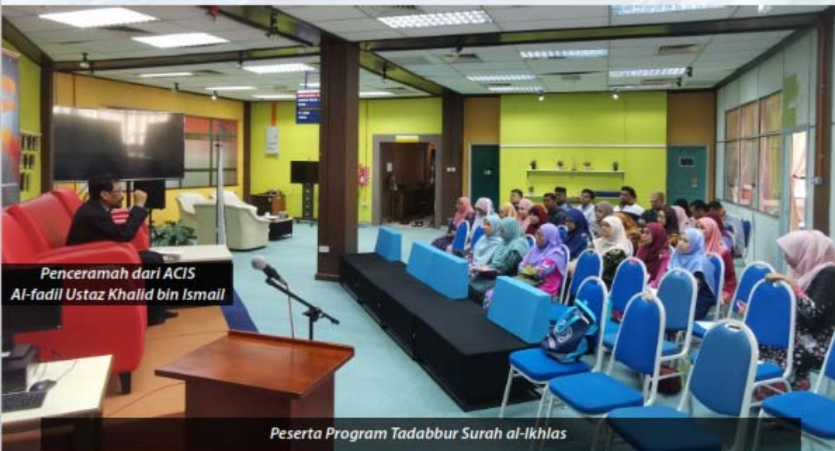
Penceramah dari ACIS