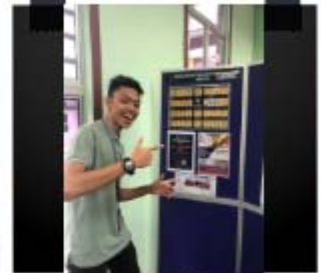
Sesi: Aktiviti Selfie di Tapak Pameran Perkhidmatan Perpustakaan Digital