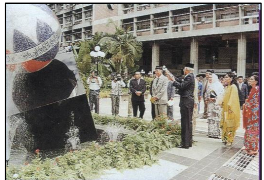
DYMM Sultan sedang mengamati lakaran yang tertulis pada permukaan jam