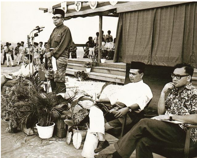
YAB. Tun Abdul Razak bin Hussein, Timbalan Perdana Menteri Malaysia sedang memberi ucapannya pada Upacara Peletakan Batu Asas ITM Batu Tiga, Jalan Klang Selangor

"Tiap-tiap penuntut MARA baik lelaki mahupun perempuan yang berdiri di hadapan khalayak ramai petang ini mestilah mensifatkan istiadat meletak batu asas Institut Teknologi MARA sebagai satu ketika riwayat hidup mereka itu bagi meletakkan batu asas pendirian mereka itu sendiri yang teguh lagi bermakna, bersendikan semangat yang cergas lagi dinamis untuk menyambut dan menjunjung hasrat amanah rakyat bumiputera pada mereka itu supaya mencari ilmu pelajaran, latihan dan kemahiran yang betul-betul akan menukarkan cara dan corak mereka itu berfikir dan hidup dengan lebih mewah, mulia, kaya dan segar yang benar-benar akan memberi makna pada bangsa dan nusa mereka itu kelak. Bangunan batu, khutub khanah berhawa dingin, bilik makmal dan tapak yang lebih lebar ini tidak akan menjadi Maktab atau ITM yang berguna jikalau pandangan penuntut tidak saujana dan fikiran, kemahuan dan semangat mereka tidak dinamis. Saya pulangkanlah pada penuntut-penuntut dan ibu bapa sekalian supaya memberi sumbangan dan menerusi fikiran yang bernas, tenaga yang kuat dan semangat mahu menyelidik dan mendalam ITM ini seimbang dengan kemajuan-kemajuan dan perkembangan-perkembangan yang diamanatkan oleh rakyat Bumiputera pada kita sekalian untuk mendirikannya. Sekarang, dengan beberapa sukacitanya saya merasmikan peletakan batu asas ITM di Batu Tiga ini."