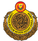
Lembaga Muzium Negeri Kedah