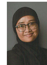
SAMIATI Geometrik Songket

Motif biasanya merujuk kepada estetika Melayu. Motif songket memerlukan penyusunan dan pengiraan. Keseimbangan karya penting memandangkan motif songket itu sendiri memerlukan ukuran dan ketepatan. Pengertian bentuk geometri dan motif songket ini berpandukan ciri-ciri pernyataan Estetika Tauhid, diperkenalkan oleh Al-Fauqi berkaitan struktur modular. Songket menunjukkan pengayaan budaya Melayu dan Islam telah mengemaskan lagi keindahan itu. Sesungguhnya kemasukan pelbagai budaya mengayakan songket Melayu dan kemasukan Islam mengemaskan lagi keindahannya itu.