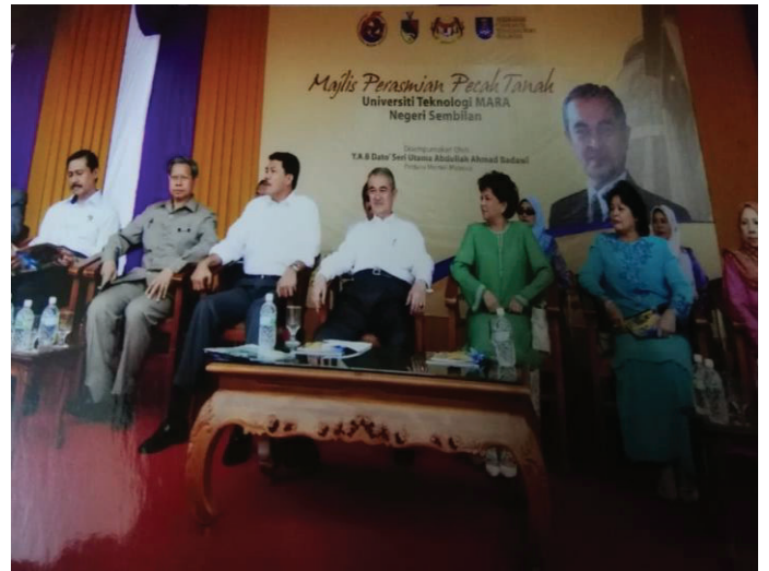
Gambar kenangan ketika Majlis Perasmian Pecah Tanah UiTM Cawangan Negeri Sembilan oleh YAB Tun Abdullah Ahmad Badawi