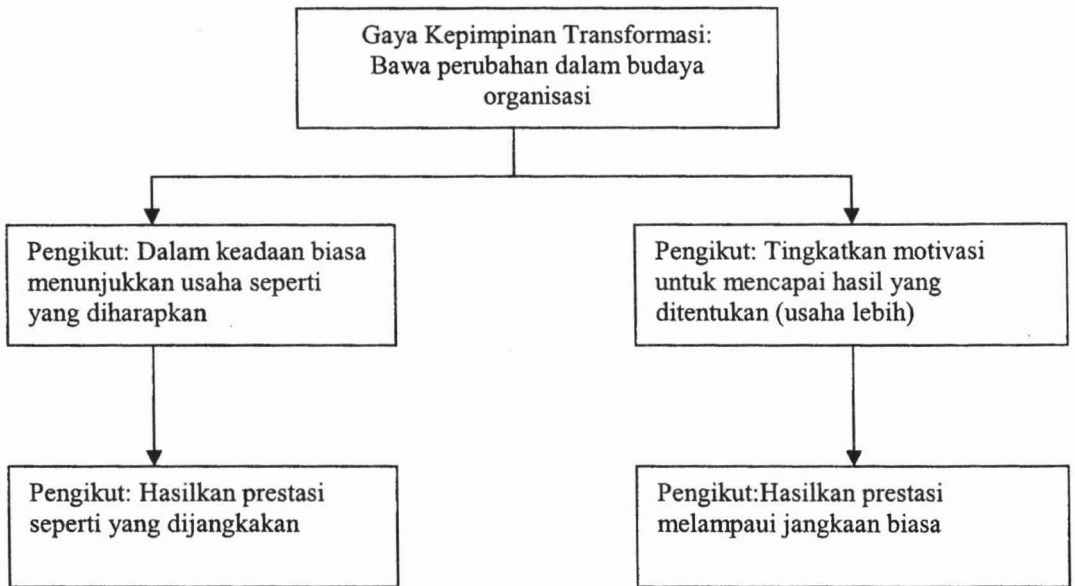
Rajah 2: Model gaya kepemimpinan transformasi.

Zaidatul Akmaliah Lope Pihie (2003), di dalam bukunya yang bertajuk Pengurusan Dan Kepemimpinan Pendidikan Satu Langkah Ke Hadapan , menyatakan kepemimpinan transformasional bertindak sebagai pemangkin perubahan dan bukan berubah untuk bertindak balas sahaja. Pemimpin seperti ini selalunya mengamalkan tingkahlaku yang menggalakkan kakitangan supaya bertindak dengan lebih yakin terhadap kemampuan diri tanpa seliaan atau arahan, ia mampu mempengaruhi subordinat secara luar biasa. Pemimpin transformasional memotivasikan kakitangannya untuk melipatgandakan usaha mereka berbanding prestasi biasa.