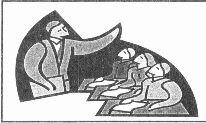
Rajah 1: Kaedah pengajaran sedia ada yang patut diubah – pelajar fokus kepada pensyarah