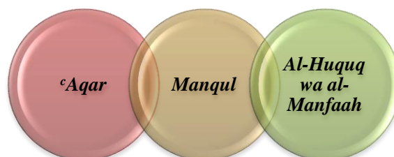
Rajah 1: Bentuk Harta Wakaf Menurut Syarak

Sejarah membuktikan semenjak pada zaman awal Islam sehingga kini, terdapat pelbagai jenis harta yang digunakan bagi tujuan wakaf. Pengamalan ini adalah hasil ijihad ulama fiqh berdasarkan amalan Nabi SAW dan para sahabat disebabkan tiada jenis harta yang spesifik boleh diwakafkan dalam Islam. Oleh yang demikian, kajian ini mendapati tiga bentuk harta wakaf yang dapat membangunkan sosio-ekonomi ummah di Malaysia iaitu Harta Tak Alih ( ‘Aqar ), Harta Alih ( Manqul ) serta Hak dan Manfaat ( Al-Huquq wa al-Manfa‘ah ).