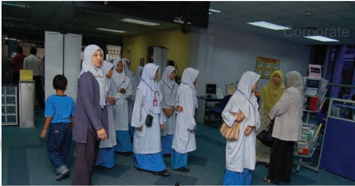
Lawatan dari Sekolah Men. Keb. Hosba Kedah - 29 Mei 2007