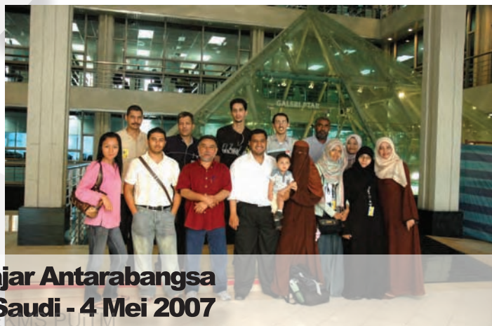
Lawatan Pelajar-pelajar Antarabangsa dari Arab Saudi - 4 Mei 2007