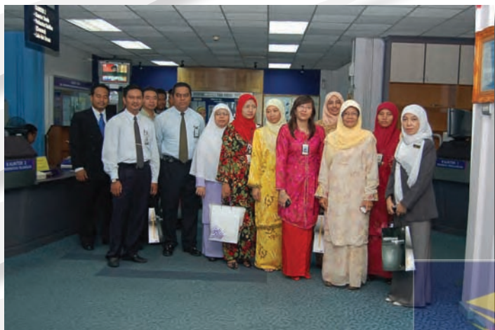
Lawatan dari Universiti Malaya 23 Mei 2007