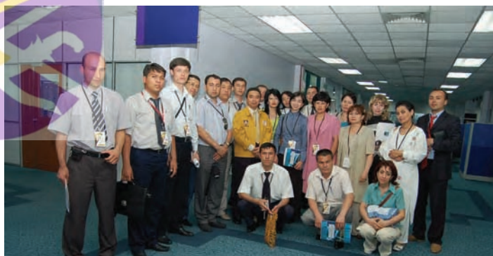
Lawatan Pelajar-pelajar Antarabangsa dari Uzbekistan - 14 Mei 2007