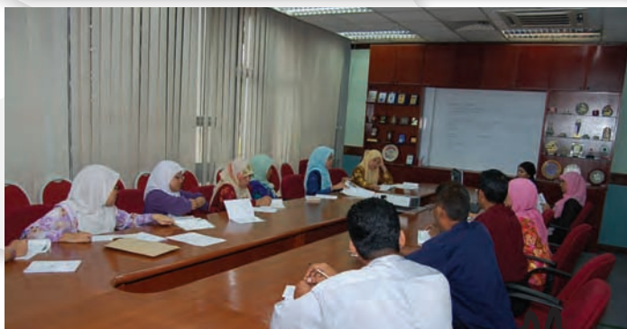
Mesyuarat 5S 8 Mei 2007