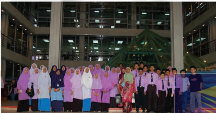
Lawatan dari Sekolah Men. Keb. Agama Wataniah, Jerneh Terengganu - 3 Mei 2007