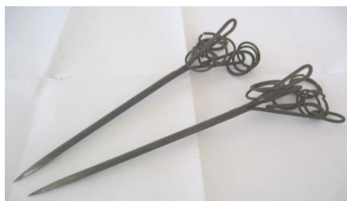
Gambar 2: Anak dabus