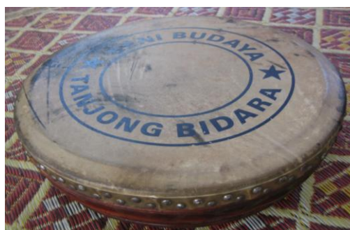
Gambar 4: Rebana Dabus

Di dalam langkah ini penari berpusing ke kiri dan ke kanan dengan tangan di angkat tinggi dan dibukakan sebagaimana burung helang menyambar mangsanya. Penari boleh memilih untuk berpusing ke kanan atau kekiri dahulu. Langkah empat memerlukan pergerakan penari melompat sambil berpusing kaki. Penari melompat menggunakan sebelah kaki sahaja samada kaki kiri atau kanan. Sekiranya melompat menggunakan kaki kiri, kaki kanan di 'gantung' dan pusing ikut arah jam. Dan sekiranya kaki kanan lompat, kaki kiri di 'gantung' dan pusing ikut lawan jam. Tumit tidak berubah kedudukan ketika melompat. Pusingan dilakukan sebanyak empat kali. Kecekapan penari amat diperlukan untuk mengimbangi badan apabila melompat menggunakan sebelah kaki sahaja. Setelah selesai penari berhenti, penari bergerak bertemu khalifah untuk dijampi pada bahagian badan yang hendak dicucuk dengan anak dabus yang tajam diujungnya. Cucukan dilakukan dilengan, lebih kurang 10 kali dan lebih. Kesan cucukan adakalanya berdarah, tetapi tidak terasa sakit.