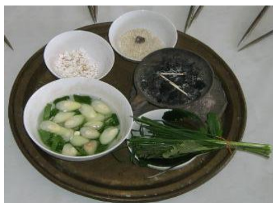
Gambar 1: Bahan jampi

Tarian ini mempunyai empat jenis langkah iaitu langkah satu (sembah pahlawan), langkah dua (lirik), langkah tiga (lang sewah) dan langkah empat (rentak tengah tiga). Empat langkah ini mengandungi elemen dalaman motif gerak tari Melayu terdiri daripada kesatuan, variasi, sikuen, kontras, klimaks, transisi, repetasi, proposisi, selaras dan harmoni, keseimbangan, AB, AB rondo, tema dan variasi, Suite dan sonata (Mohd Nefi Imran Djamaan, 2003). Setiap langkah disusuli dengan gerak kaki, gerakan lengan dan tangan, gerakan badan, gerakan kepala dan muka serta mata. Langkah satu (sembah pahlawan) digerakkan sebagai pembuka tirai persembahan. Penari bergerak masuk ke gelanggang dari kiri atau kanan atau kedua-dua arah serentak setelah nyanyian lagu ke peringkat hadi. Penari akan menunduk hormat dan seterusnya mencangkung untuk memulakan tarian dengan bergerak ke hadapan empat langkah dan ke belakang empat langkah. Badan perlu diimbangi ketika berada diposisi mencangkung. Selepas empat langkah penari berdiri dan menunduk hormat. Langkah kedua (lirik) memerlukan pergerakan ke tepi empat langkah ke kanan dan ke kiri. Setelah selesai bergerak ke langkah ke tiga iaitu Lang Sewah. Langkah lang sewah lebih agresif seolah-olah menyerupai pergerakan burung helang.