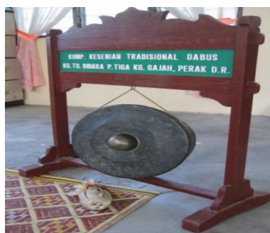
Gambar 3: Gong