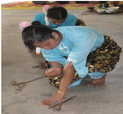
Gambar 5: Penari mencucuk lengan