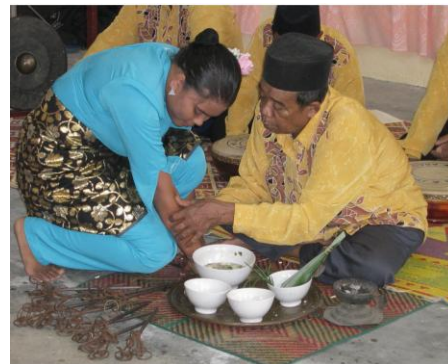
Gambar 6: Penari sedang dijampi luka