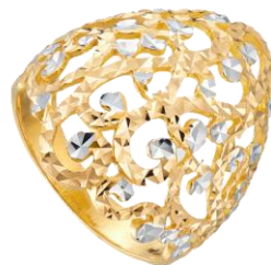
Illustrasi 5: Inspirasi motif Awan Larat sebagai cincin, 2000. http://www.habibjewels.com/collections-gold.asp , 23 November 2015