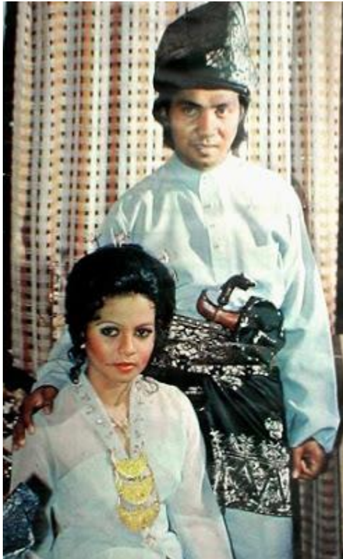
Illustrasi 2: Hiasan kepala cucuk sanggul dan dokoh berinspirasi motif bunga, 1977. http://ladylista.cari.com.my/portal , 23 November 2015.