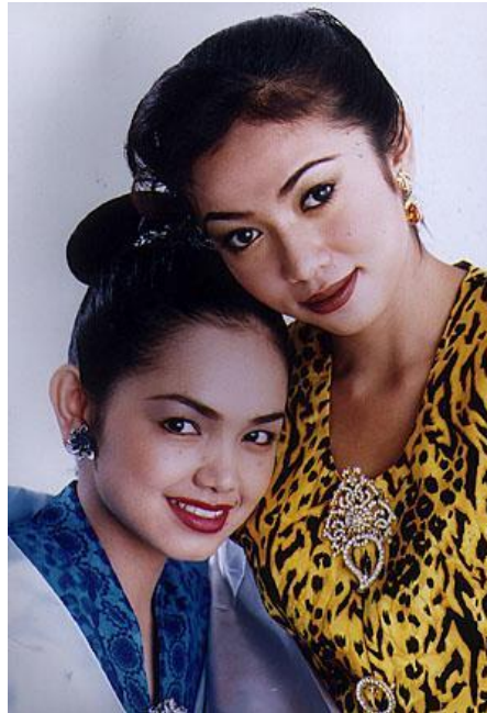
Illustrasi 4: Kerongsang tiga biji terdiri daripada kerongsang ibu dan dua kerongsang bulat yang bermotifkan bunga, 1998. http://artismalaysia.artismelayu.net/ 23 November 2015