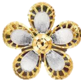
Illustrasi 7: Inspirasi Rekabentuk Tampuk Manggis sebagai kerongsang, 2015. http://www.habibjewels.com/collections-gold.asp , 23 November 2015.