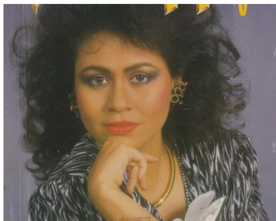
Illustrasi 3: Rantai leher, 1980. https://deanhoxton.wordpress.com , 23 November 2015