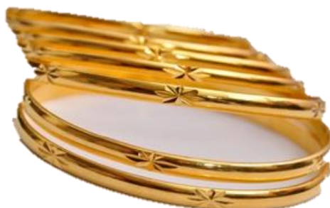
Illustrasi 8: Inspirasi motif bunga lawang sebagai gelang tangan belah rotan, 2015. http://qalbupower.blogspot.my/2011 , 23 November 2015