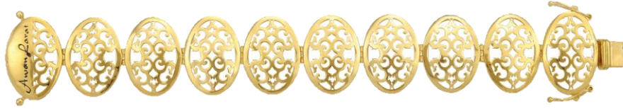
Illustrasi 6: Inspirasi Rekabentuk dokoh bermotifkan Awan Larat sebagai rantai tangan, 2014. http://www.sripinang.com/awan-larat/ , 23 November 2015.