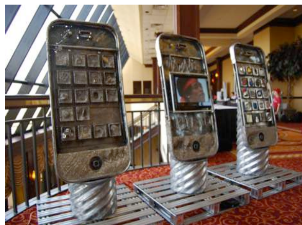
Rajah 4. Roger Belveal, "My Favorite Machine", 2012.

Di mana-mana sahaja manusia beraktiviti menggunakan telefon mudah alih. Berbagai-bagai ragam dan cara penggunaan boleh dilihat melibatkan rutin harian, tabiat sosial, dan sikap individu ketika beraktiviti dengan alat teknologi mobile. Keadaan ini telah membentuk satu fenomena gaya hidup popular masyarakat yang mana semua orang membawa telefon bimbit ke mana-mana dan akses padanya pada bila-bila masa. Masyarakat amat bergantung kepada komunikasi digital dan internet menerusi media sosial dalam setiap aktiviti harian mereka. Ini menunjukkan bahawa alat teknologi ini amat penting pada masyarakat dalam menjalani kehidupan harian.