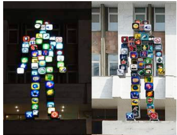
Rajah 3. Aristarkh Chernyshev and Alexei Shulgin, "Icon Man", 2011. Dynamic light sculpture.

Karya ini tergolong dalam genre seni arca awam yang memaparkan susunan ikon menjadi sebuah rekaan robot gergasi. Karya arca setinggi tiga meter ini merupakan kotak cahaya (light box) yang dinamik mewakili seorang lelaki yang seluruh badannya diperbuat daripada ikon rangkaian sosial dan aplikasi internet yang sangat popular. Karya ini menghiasi landskap Perm, Russia dan menjelaskan tentang obsesi masyarakat setempat yang menerima teknologi digital sebagai amalan budaya hidup mereka seharian (Rajah 3).