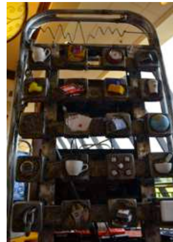
Rajah 6. (detail)

Ikon yang dihasilkan ini menceritakan tentang pengaruh penggunaan teknologi dalam memudahkan kehidupan harian. Ikon yang dihasilkan secara tiga dimensi dengan penggunaan objek harian seperti cawan, jam tangan dan lain-lain, sebagai simbol aktiviti dan kehidupan manusia yang tidak boleh lari dari pengaruh teknologi. (Rajah 6).