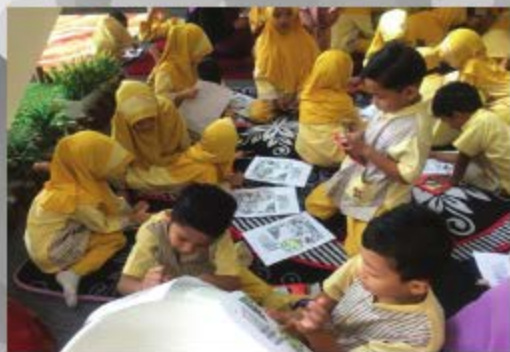
TADIKA LITTLE CALIPHS, KULIM TARIKH: 11 OKTOBER 2018 TEMPAT: PERPUSTAKAAN TUN ABDUL RAZAK, UITM CAWANGAN PULAU PINANG, KAMPUS PERMATANG PAUH