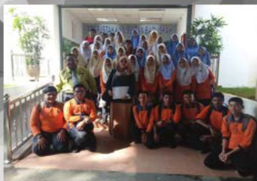
SMK MERBOK TARIKH: 23/10/2018 TEMPAT: PERPUSTAKAAN SULTAN BADLISHAH UITM CAW. KEDAH