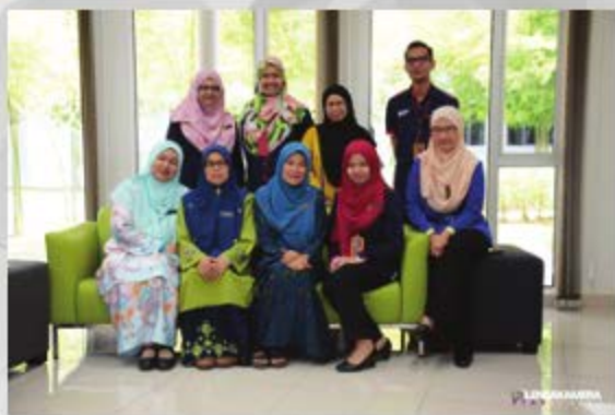
LAWATAN SMK KG BARU SI RUSA, PORT DICKSON TARIKH: 17 OKTOBER 2018 TEMPAT: PTAR KAMPUS REBAU