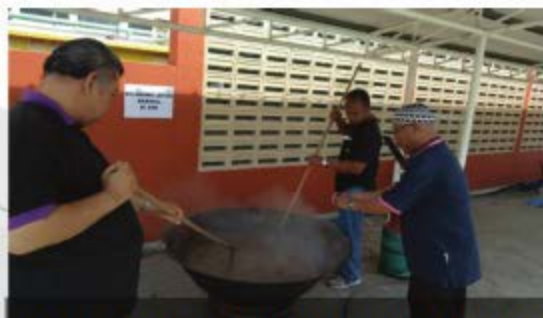
PROGRAM BUBUR ASYURA PERPUSTAKAAN CENDEKIAWAN 2018 PERKARANGAN PERPUSTAKAAN CENDEKIAWAN KAMPUS DUNGUNG - 8 OKTOBER 2018