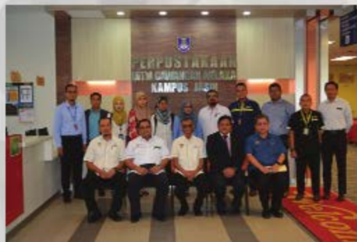
LAWATAN KERJA KETUA PENGARAH UKAS TARIKH: 23 OKTOBER 2018 TEMPAT: PERPUSTAKAAN UITM CAWANGAN MELAKA KAMPUS JASIN