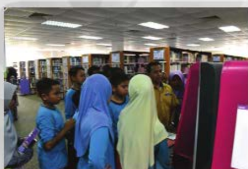
SK JENKA PUSAT 2, JENKA TARIKH: 26 OKTOBER 2018 TEMPAT: PERPUSTAKAAN AL-BUKHARI, UITM CAW. PAHANG, KAMPUS JENKA