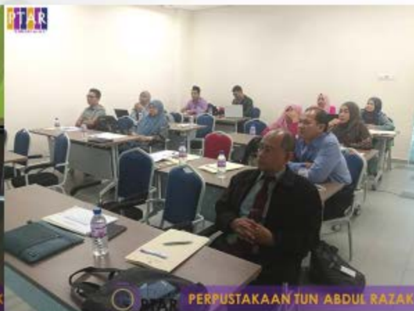
PERPUSTAKAAN TUN ABDUL RAZAK