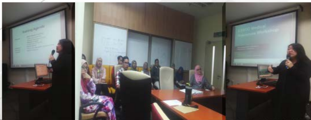
TIPS & TECHNIQUES TO YOUR EBSCO CONTENT PERPUSTAKAAN, KAMPUS SG BULOH (FAKULTI PERUBATAN & PERGIGIAN) - 25 OKTOBER 2018