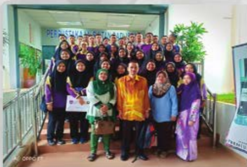
SMK SERI GUNONG TARIKH: 25/10/2018 TEMPAT: PERPUSTAKAAN SULTAN BADLISHAH, UITM CAW. KEDAH