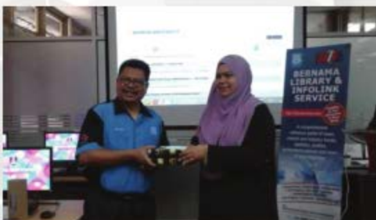
LATIHAN PANGKALAN DATA ATAS TALIAN: BERNAMA LIBRARY & INFOLINK SERVICE (BLIS) 2018 PERPUSTAKAAN CENDEKIAWAN KAMPUS DUNGUNG - 1 OKTOBER 2018