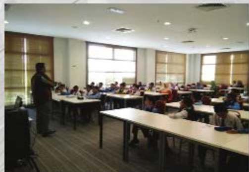
SEKOLAH KEBANGSAAN SELANDAR, MELAKA TARIKH: 19 OKTOBER 2018 TEMPAT: PERPUSTAKAAN UITM CAWANGAN MELAKA KAMPUS JASIN