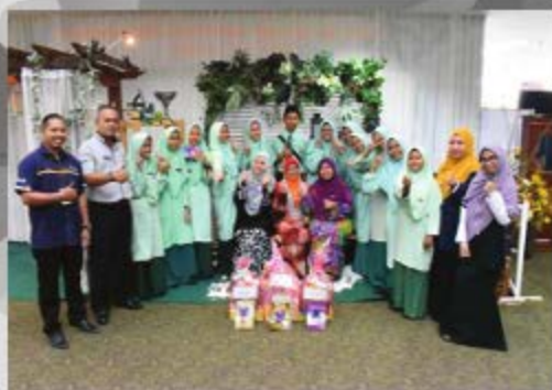
SMK JENKA 16, JENKA TARIKH: 10 OKTOBER 2018 TEMPAT: PERPUSTAKAAN AL-BUKHARI, UITM CAW. PAHANG, KAMPUS JENKA