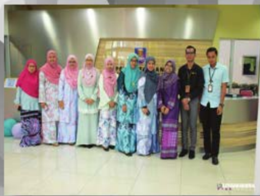
LAWATAN DARIPADA SMK UNDANG REBAU TARIKH: 16 OKTOBER 2018 TEMPAT: PTAR KAMPUS REBAU