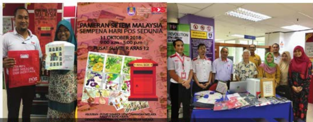
PAMERAN SETEM MALAYSIA SEMPERNA HARI POS SEDUNIA 2018 UITM CAWANGAN MELAKA KAMPUS BANDARAYA - 11 HINGGA 31 OKTOBER 2018