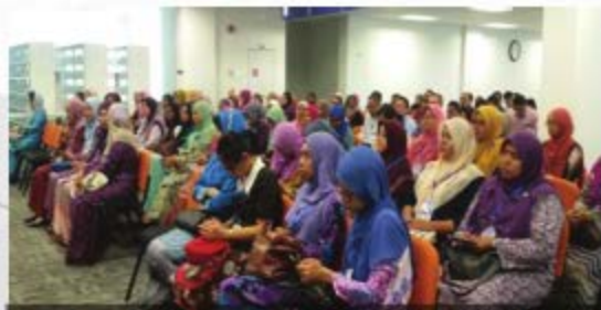
BENKEL JURULATIH UTAMA PEMBUDAYAAN STEM MELALUI INQUIRY-BASED SCIENCE EDUCATION (IBSE) PERINGKAT NEGERI MELAKA TAHUN 2018 PERPUSTAKAAN UITM CAWANGAN MELAKA KAMPUS JASIN - 8 HINGGA 11 OKTOBER 2018