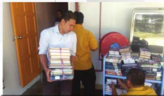
PEMINDAHAN BUKU DARI PERPUSTAKAAN UITM CAWANGAN KAMPUS DUNGUNG KE PERPUSTAKAAN UITM CAWANGAN PAHANG KAMPUS RAUB PERPUSTAKAAN CENDEKIAWAN UITM CAWANGAN TERENGGANU - 15 OKTOBER 2018