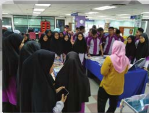
LAWATAN SMA MARANGTERENGGANU TARIKH: 19 OKTOBER 2018 TEMPAT: PUSAT SUMBER, UITM CAWANGAN MELAKA, KAMPUS BANDARAYA