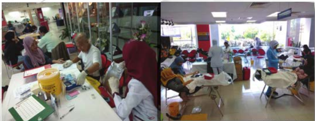
PROGRAM KESIHATAN: DERMA DARAH UITM CAWANGAN MELAKA, KAMPUS BANDARAYA - 30 HINGGA 31 OKTOBER 2018