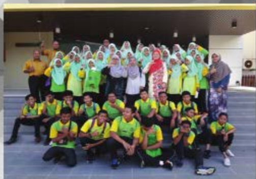
PENGAWAS PUSAT SUMBER SMK PULAU SERAI TARIKH: 15 OKTOBER 2018 TEMPAT: PERPUSTAKAAN CENDEKIAWAN KAMPUS DUNGUN, UITM CAWANGAN TERENGGANU