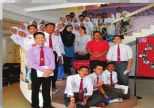
SMK BADIN TUARAN TARIKH: 04 OKTOBER 2018 TEMPAT: PTAR UITM CAWANGAN SABAH