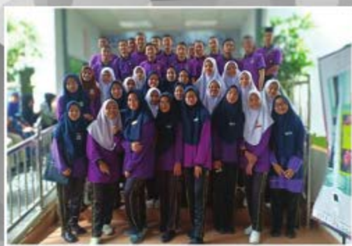
SMK SG. LAYAR TARIKH: 24/10/2018 TEMPAT: PERPUSTAKAAN SULTAN BADLISHAH, UITM CAW. KEDAH