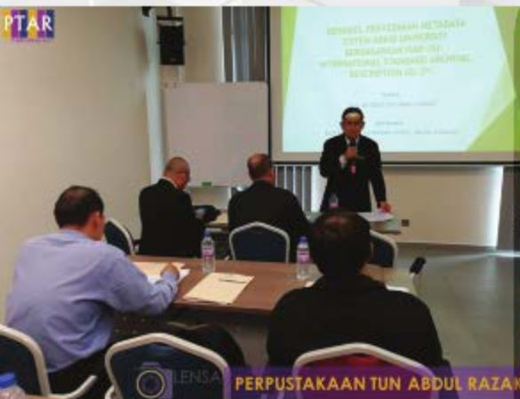
PERPUSTAKAAN TUN ABDUL RAZAK

Membangunkan Metadata Sistem Arkib berdasarkan ISAD (G): General International Standard Archival Description - Second Edition.