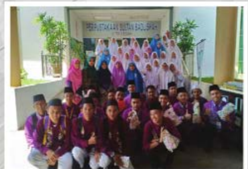
MAKTAB MAHMUD MERBOK TARIKH: 24/10/2018 TEMPAT: PERPUSTAKAAN SULTAN BADLISHAH UITM CAW. KEDAH