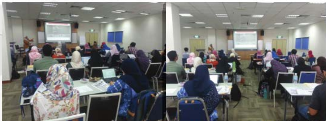
SCIENTIFIC WRITING WORKSHOP 3: RESEARCH PROPOSAL WRITING & PRESENTATION PERPUSTAKAAN, KAMPUS SG BULOH (FAKULTI PERUBATAN & PERGIGIAN) - 9 OKTOBER 2018