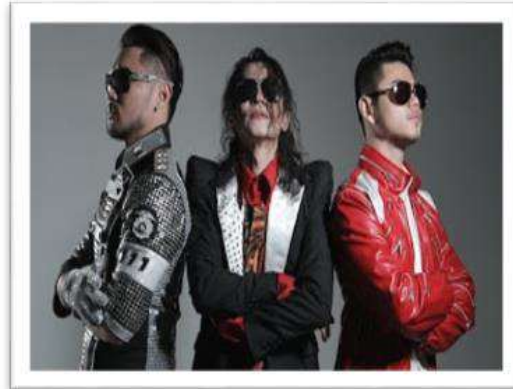
Gambar 1 : Fesyen gayaan Michael Jackson.

Gayaan jalanan pun menunjukkan budaya pop tersebar mekar diiringi tarian unik yang dihasilkan oleh MJ. Populariti MJ bukan sahaja signifikan pada golongan anak muda melayu sahaja bahkan anak muda dari golongan cina dan india turut meresapi kegilaan tersebut sehinggalah ada anak- anak cina ingin mengkerintingkan rambut mereka dan anak anak muda india sudah menjadi trademark mereka berkulit gelap susuk tubuh yang kurus tinggi rambut kerinting halus pula dengan senang hati menari gayaan Mj atau dikenali sebagai breakdance atau robot dance tanpa segan silu walaupun didendangkan dengan lagu pop tamil.