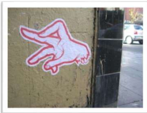
Gambar 13 : Tandaan kumpulan menggunakan teknik imej pelekat (Kolaj).