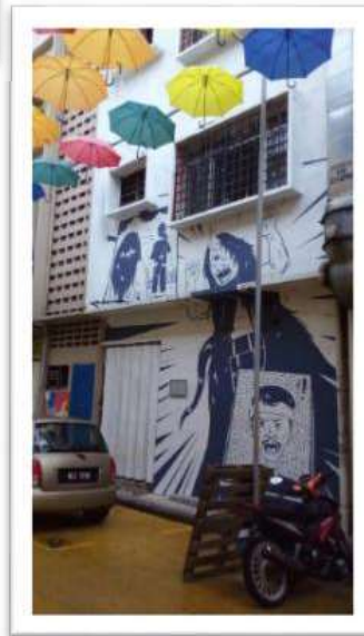
Gambar 22 : Mural bertemakan cerita rakyat seperti Hikayat Badang.