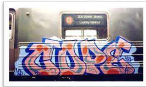
Gambar 16 : Tagging Grafiti pada badan keretapi.

Tagging grafiti kian mendapat tempat dan menjadi perhatian golongan belia di negara ini, tidak dapat dinafikan asal-usul seni grafiti melalui subbudaya Hip Hop dapat diterima oleh masyarakat dunia dengan tertubuhnya banyak kumpulan seni grafiti tanah air. Seni grafiti melalui acuan nasionalisme negara kian popular kerana kumpulan – kumpulan ini boleh berinteraksi sesama ahli mereka sambil mendapat keseronokan menghasilkan karya kreatif. Nama nama seperti Cloarkwork, Kenji Chai, Katun, Punk Rock , kumpulan Kereko dan banyak lagi, telah banyak merubah dinding- dinding kota dan tembok- tembok di negara ini dipenuhi dengan seni grafiti ataupun mural yang berbagai bentuk pengucapannya. Cerita- cerita hikayat, cerita rakyat, potret ikon- ikon negara, serta berbagai-bagai imej bercampur baur dalam membentuk identiti tersendiri yang indah sifatnya cuba dihasilkan.