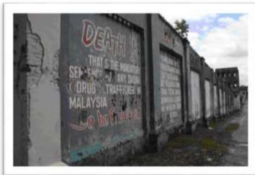
Gambar 6 : Mural Penjara Pudu.

Di Jalan Pudu juga menyimpan banyak kewujudan seni graffiti terawal, semenjak negara Malaysia mendapat kemerdekaan pada zaman penjajahan British mahupun zaman selepas kolonialisasi pihak British. Salah satu buktinya adalah lukisan mural Penjara Pudu yang dihasilkan pada tahun 1982. Menurut Harith Faruqi Sidek dalam tulisannya mural graffiti Penjara Pudu menyimpan satu kisah sebelum penghasilannya, barang siapa yang menaiki bas menuju ke Puduraya, mereka akan melewati karya seni bertemakan pemandangan hutan tropika tersebut.