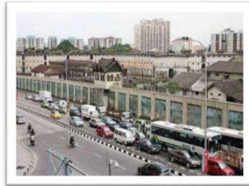
Gambar 7 : Mural sepanjang Jalan Pudu.