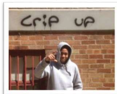
Gambar 11 : Tanda grafiti oleh Kumpulan Crips.