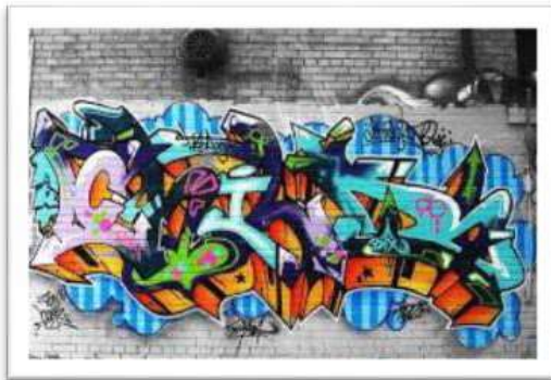
Gambar 14 : Salah satu contoh Tagging Grafiti.