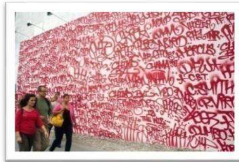
Gambar 15 : Contoh karya Tagging Grafiti.