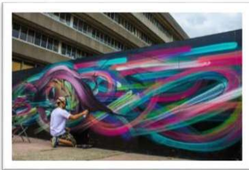
Gambar 19 : Tagging grafiti yang dihasilkan oleh anak muda tempatan.