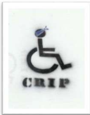
Gambar 12 : Tanda grafiti menggunakan teknik stensil oleh Kumpulan Crips.