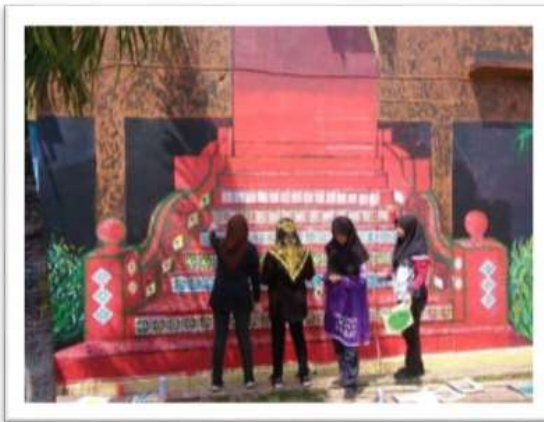
Gambar 17 : Pelajar- pelajar dari Jabatan Seni Halus Cawangan Melaka sedang menyiapkan mural.