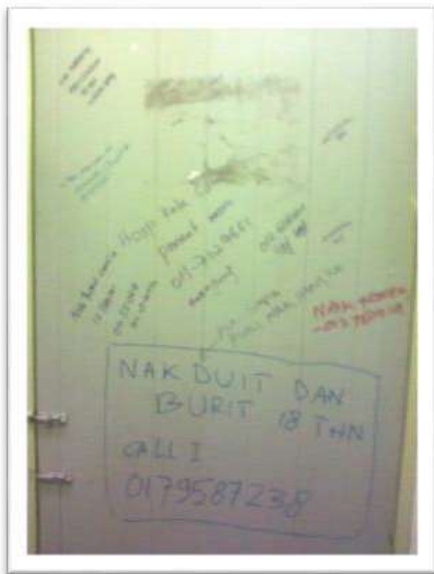
Gambar 3 : Contoh vandalisme di tempat awam.

tandas awam mahupun ruangan publik, tindakan juga boleh dikenakan kerana merosakkan harta awam. Namun begitu apa yang dilakukan oleh Keth Haring jauh sekali untuk kita mengecam beliau di bawah akta merosakan harta awam. Beliau menghasilkan satu karya bertajuk Crack is Wack pada satu dinding awam yang terletak di 128th Street di kawasan 2nd Avenue, beliau didenda $25.00 oleh Peguatuksa Bandaran atas alasan menconteng dinding awam. Namun apa yang cuba disampaikan oleh Keith adalah berkenaan penggunaan dadah kokain telah meruntuhkan sistem keluarga dan masyarakat di New York pada waktu itu.