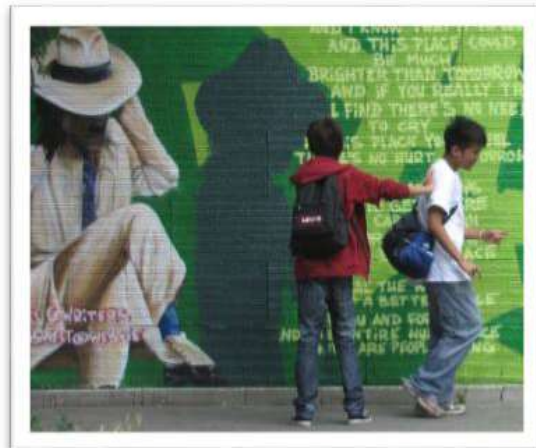
Gambar 2 : Remaja dan mural figura Michael Jackson.

Era 80an juga mengingatkan kita pada kemunculan seniman jalanan asal Amerika sekaligus aktivis sosial, Keith Harring adalah seniman kontemporari merubah seni jalanan ke arah seni yang bertemakan politik, seksualitis, perang, agama dan wabak AIDS. Ketika kebanyakan seniman jalanan waktu itu menjadikan subway atau dinding lorong sebagai kanvas mereka dan senjatanya adalah spray paint . Keith Harring pula bereksperimen menggunakan kapur tulis dan kebanyakan mural beliau berorientasikan warna gelap pada latar belakang. Kalau di Malaysia waktu itu graffiti wujud dalam kontek vandalism yang agak sempit dan selalu dilakukan oleh remaja bermasalah pada tandas-