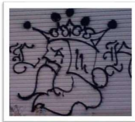
Gambar 10 : Gang grafiti yang dimiliki oleh kumpulan Latin King.

Manakala Tagging grafiti sering digunakan sebagai grafiti kumpulan dan individu yang dikenali sebagai 'bomber', semakin mendapat tempat dan tersebar meluas hingga ke negara asia seperti Korea, Jepun, Filipina malahan negara kita Malaysia. Semakin banyak grafiti jenis ini bertebaran, semakin terkenallah nama pembuatnya, Tagging grafiti yang bernaung di bawah sesuatu kumpulan mahupun individu memiliki peminat atau followers dalam negara mahupun luar negara. Kelompok- kelompok seperti Skulls Savage, La Familia dan Savage Nomad seringkali mendapat perhatian dan secara aktif menandai wilayah mereka.