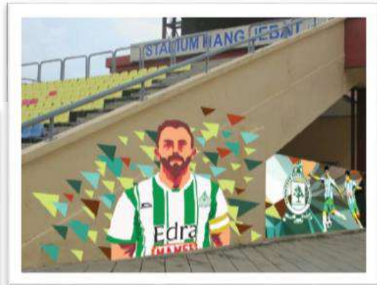
Gambar 21 : Mural untuk Kelab bolasepak di Stadium Hang Jebat, Melaka.