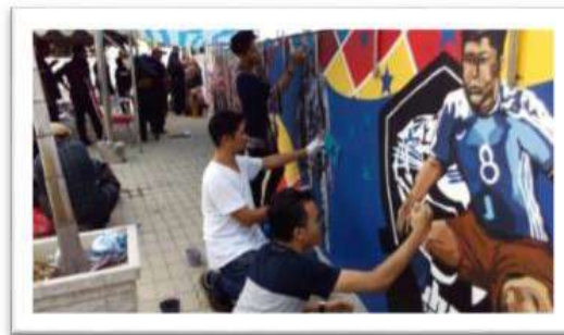
Gambar 4 : Program melukis mural oleh Jabatan Seni Halus Melaka.

Justeru dengan kenyataan Tisna Sanjaya, kesenian mural bukanlah seperti kita rasakan sebagai satu wadah yang tiada kepentingan dalam pandangan umum. Tarian breakdance atau tarian robot serta fesyen dan kegilaan budaya muzik pop mahupun rap serta kunikan gerakan tarian serta dinding graffiti merupakan gabungan seni yang dirancang secara tidak langsung dan memaparkan terjemahan masyarakat pada waktu itu yang hidup aktif dan penuh dengan semangat urban dan berlakunya interaksi sosial yang unik dan positif.