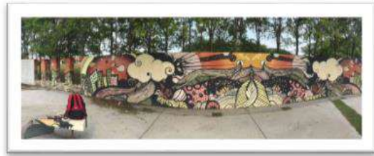
Gambar 20 : Mural dan grafiti di Stadium Hang Jebat Melaka.

inisiatif dalam memberi ruang kepada anak-anak muda yang kreatif dalam penghasilan seni mural dan seni grafiti agar berkembang pesat sebagai satu wadah kesenian yang dekat dengan diri masyarakat ataupun sebagai satu inisiatif untuk mempopularkan imej setempat dan juga boleh menarik perhatian pengunjung serta pelancong di dalam negara dan luar negara, inisiatif tersebut telah banyak dilakukan oleh kerajaan dan badan tertentu seperti NGO dan sebagainya.