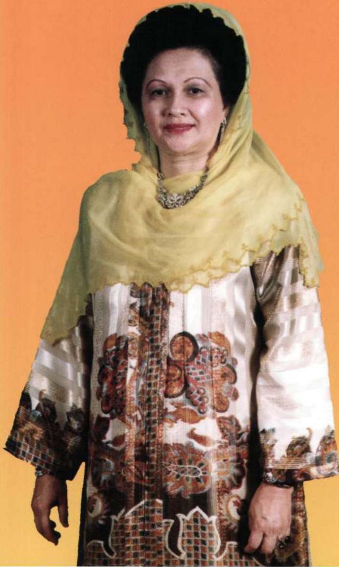
Seri Paduka Baginda Raja Permaisuri Agong Tuanku Fauziah Binti Al-Marhum Tengku Abdul Rashid