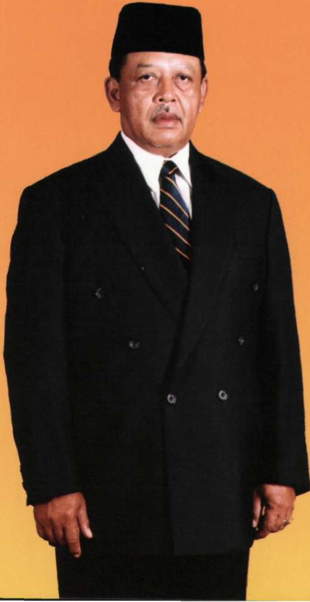
Seri Paduka Baginda Yang di-Pertuan Agong XII Tuanku Syed Sirajuddin Ibni Al-Marhum Tuanku Syed Putra Jamalullail