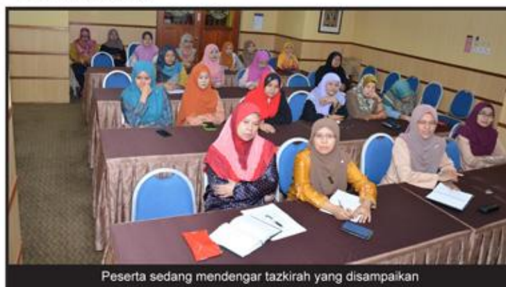
Peserta sedang mendengar tazkirah yang disampaikan