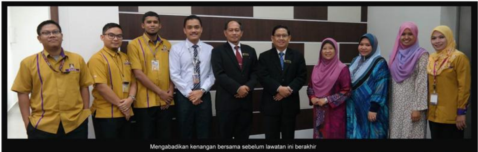
Mengabadikan kenangan bersama sebelum lawatan ini berakhir