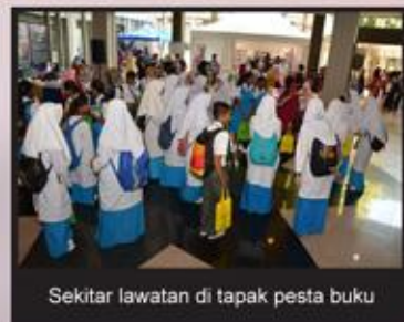
Sekitar lawatan di tapak pesta buku