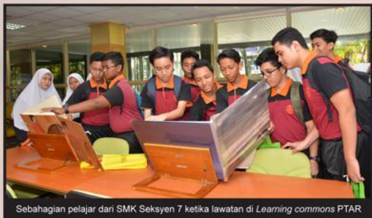
Sebahagian pelajar dari SMK Seksyen 7 ketika lawatan di Learning commons PTAR

Pelajar dari Sekolah Menengah Kebangsaan Seksyen 16 pula tiba pada jam 12 tengahari yang terdiri daripada 2 orang guru pengiring dan 40 orang pelajar.