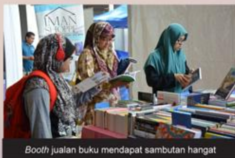
Booth jualan buku mendapat sambutan hangat