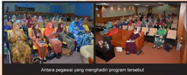
Antara pegawai yang menghadiri program tersebut