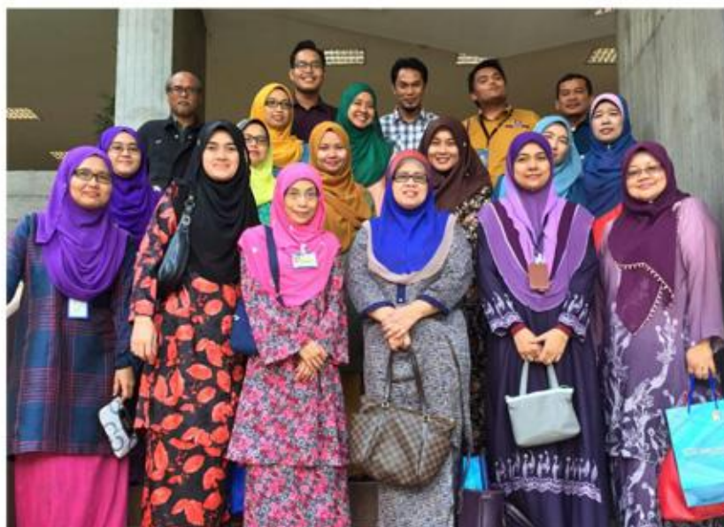
Delegasi dari PTAR mengabadikan kenangan bersama dengan staf Perpustakaan Tun Sri Lanang

"RDA merupakan singkatan bagi Resource Description and Access. Ia merupakan peraturan standard baru antarabangsa bagi pengkatalogan yang menggantikan Anglo-American Cataloguing Rules 2nd edition (AACR2). RDA merupakan alat pengkatalogan (cataloguing tools) atas talian bagi memenuhi keperluan dunia digital mas kini kerana AACR tidak lagi dapat menampung keperluan tersebut. Semua perpustakaan di Malaysia telah disarankan oleh Perpustakaan Negara Malaysia (PNM) untuk mengaplikasi penggunaan RDA bagi memastikan rekod pengkatalogan adalah selari dengan keperluan standard antarabangsa."