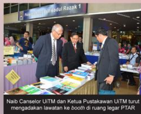
Naib Canselor UiTM dan Ketua Pustakawan UiTM turut mengadakan lawatan ke booth di ruang legar PTAR

Turut diadakan pelbagai aktiviti sempena program ini iaitu Cabutan Bertuah, Pertandingan Ulasan Buku, Pertandingan Video Pendek, Pertandingan Menulis Esei, Instagram Challenge dan Slot Penerbit.