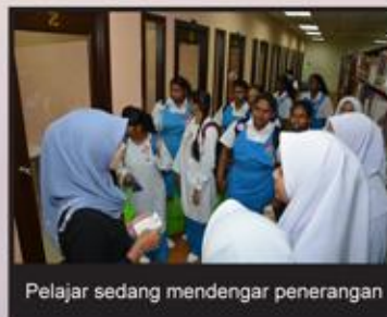
Pelajar sedang mendengar penerangan

Tiba pada jam 10 pagi di PTAR, lawatan oleh Sekolah Menengah Seksyen 7 diwakili oleh 2 orang guru pengiring dan 34 orang pelajar yang terdiri dari murid tingkatan 3 dan 4.