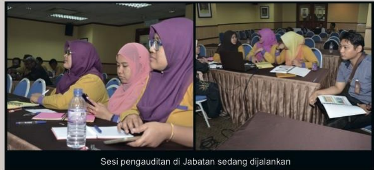
Sesi pengauditan di Jabatan sedang dijalankan

Tema pada kali ini adalah menumpukan proses kerja dalaman PTAR. Seramai 38 orang Auditor Dalam yang terdiri daripada Pustakawan & Pustakawan Kanan telah terlibat dalam sesi pengauditan kali ini.