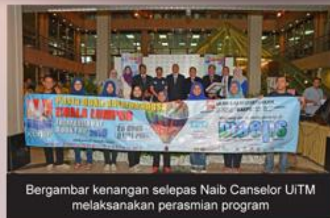
Bergambar kenangan selepas Naib Canselor UiTM melaksanakan perasmian program

Program ini melibatkan sebanyak 20 penerbit tempatan yang mempromosikan buku-buku terbitan mereka. Sesi pemilihan buku turut diadakan untuk Jabatan/ Pusat/Unit Dalamuan UiTM.