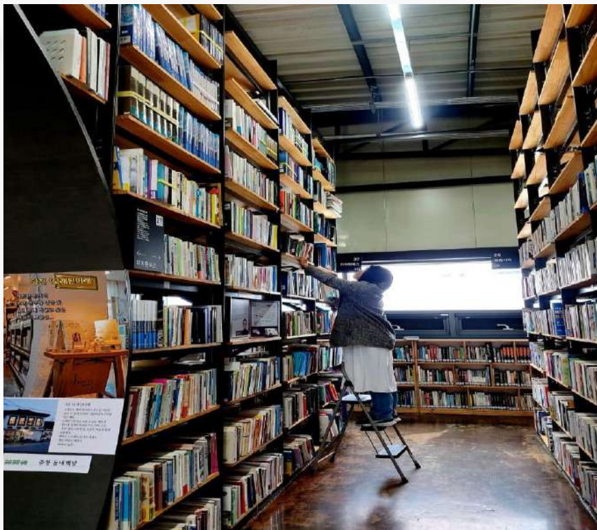
Bukti kegigihan penulis mencari buku-buku berbahasa Inggeris di Seoul Book Repository