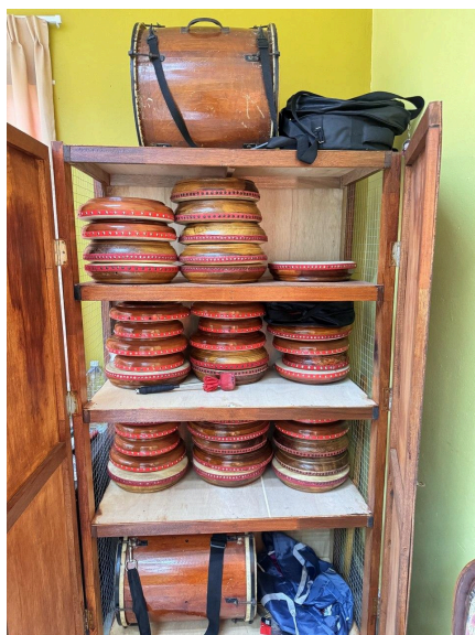
Gambar 2: Almari penyimpanan kompang