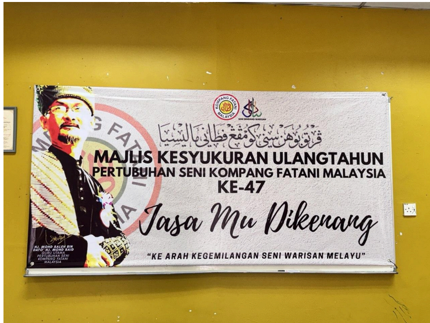
Gambar 4: Moto Pertubuhan Seni Kumpang Fatani Malaysia