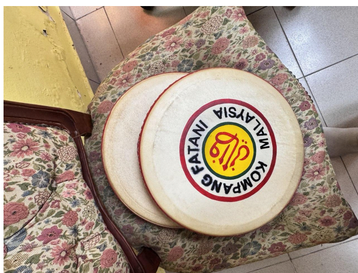
Gambar 3: Kompang saiz empat belas inci