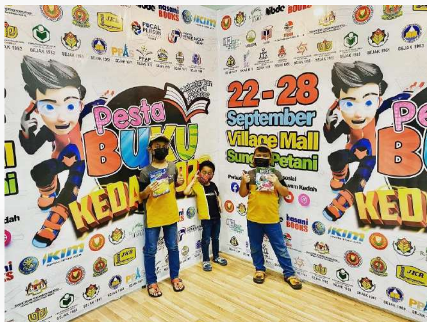
Pesta Buku, lokasi wajib setiap tahun untuk anak-anak!!!

Momen-momen kecil macam ni buat saya sedar yang membaca sebenarnya bukan sekadar aktiviti individu, tapi juga satu cara untuk mengeratkan hubungan keluarga.