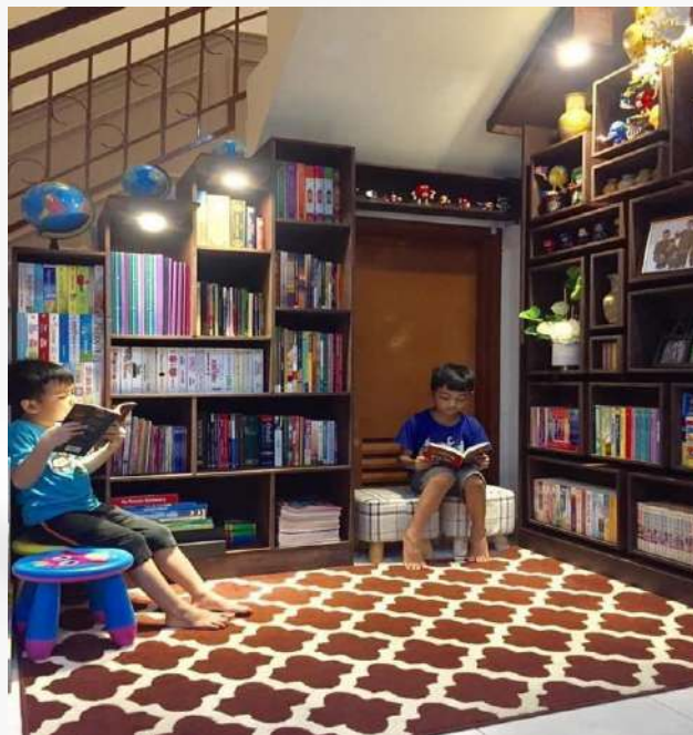
Sudut bacaan di rumah. Lokasi kegemaran hero bertiga di rumah

Oh ya, kalau ada rezeki lebih, boleh cuba buat sudut bacaan di rumah. Kami juga masih baru berjinak-jinak dengan menyediakan satu sudut bacaan, tapi hasilnya memang best! Bila ada satu tempat khas untuk membaca, anak-anak lebih teruja. Bonusnya? Rumah pun nampak lebih kemas dan cantik. Cumanya, kami sekeluarga juga automatis perlu lebih rajin mengemas ruang tersebut.