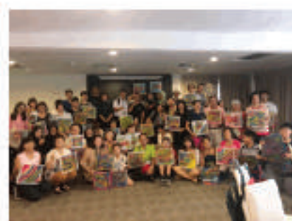
Peserta bersama hasil kerja mewarna batik