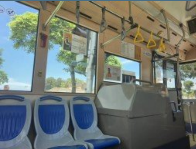
Keadaan dalam bas yang selesa

Bas Percuma di Pulau Pinang, Jelajah Bandar Tanpa Kos!