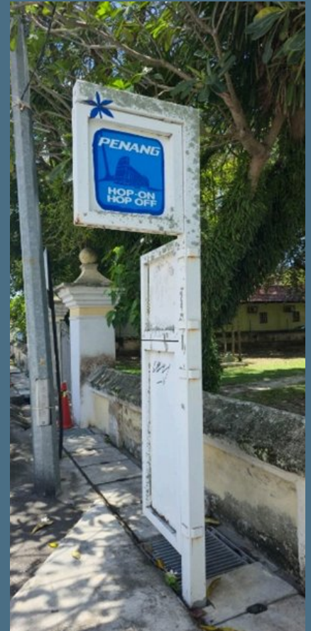
Boleh menunggu bas di hentian yang bertanda CAT atau Hop On Hop Off

Bas Percuma di Pulau Pinang, Jelajah Bandar Tanpa Kos!