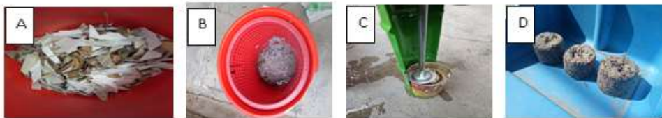
Rajah 1. A = Langkah 1, B = Langkah 2, C = Langkah 3, D = Langkah 4

Langkah pertama yang dilakukan ialah kumpulkan kertas, rumput, daun kering dan ranting kayu. Langkah kedua, rendam kertas ke dalam air selama 2 hari. Selepas 2 hari, proses semula kertas menjadi cebisan kecil. Langkah ketiga, gabungkan daun kering rumput, ranting kayu dan kertas ke dalam alat pemampat. Mampatkan sehingga keluar kandungan air. Langkah terakhir, titiskan 5ml ekstrak serai wangi. Jemur sehingga kering dan tablet magik bio arang serai wangi boleh digunakan. Rajah 1.1 menunjukkan cara-cara menghasilkan MLT-Serai wangi.