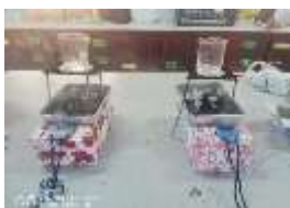
Rajah 3. Ujikaji ketiga