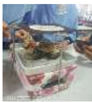
Rajah 2. Ujikaji kedua