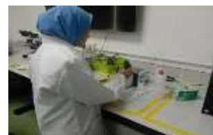
Rajah 4. Ujikaji keempat