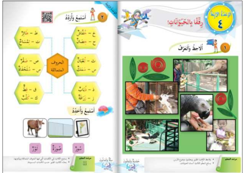
Gambar 2: Buku teks bahasa Arab KSSR Tahun 5 tentang topik menyantuni haiwan

Ayat ini menunjukkan bahawa manusia dilantik oleh Allah sebagai khalifah di bumi, iaitu pemegang amanah yang bertanggungjawab untuk mengurus, memelihara dan memakmurkan alam sekitar menurut perintah dan hukum Allah. Manakala perkataan seperti amanah, hisab dan