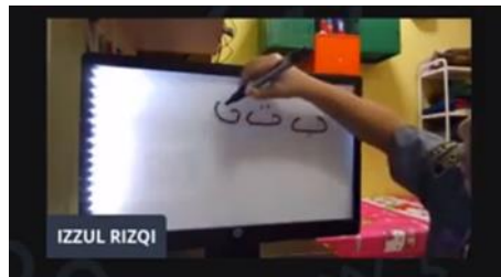
Figure 1: Papan Pelangi