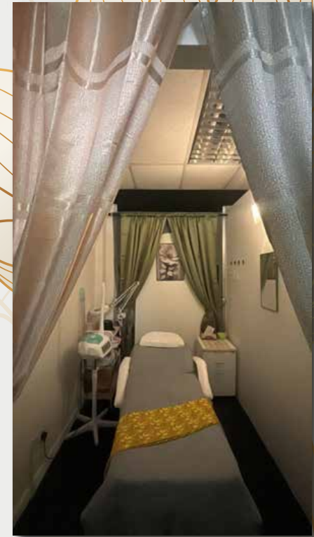
Bilik rawatan wajah