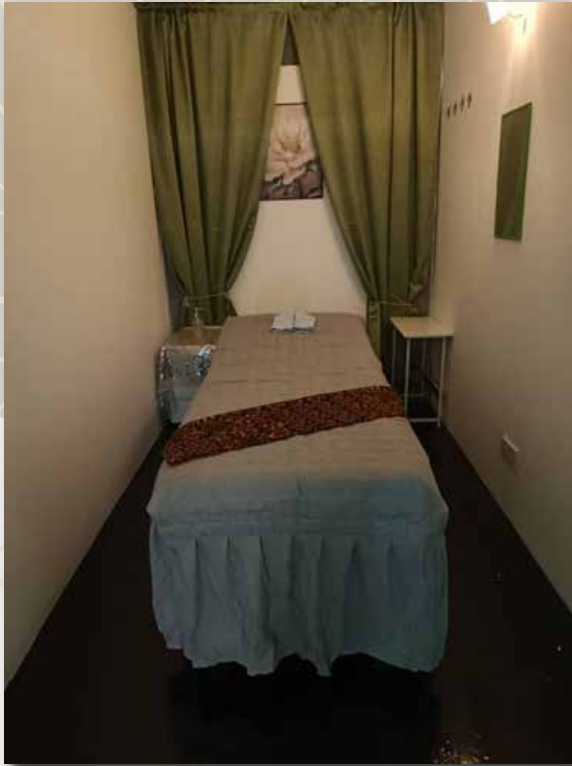
Bilik Rawatan Badan