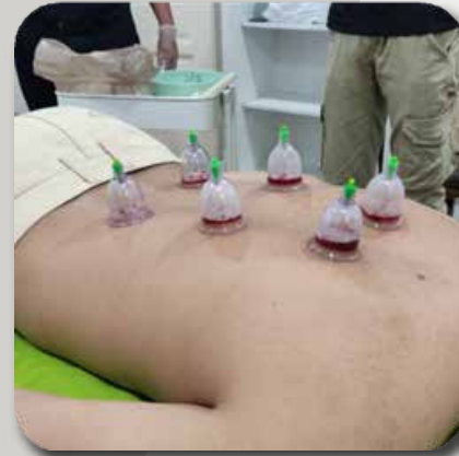
2) Pakej Sport Massage dan Bekam