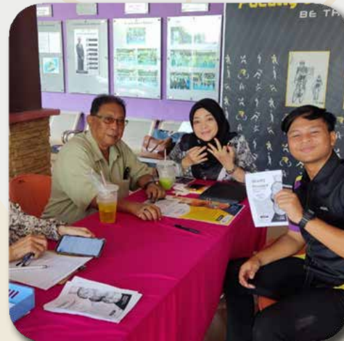
Reach out di Fakulti Sains Sukan dan Rekreasi