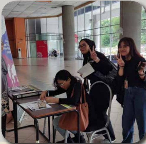
Reach out di Fakulti Seni Kreatif