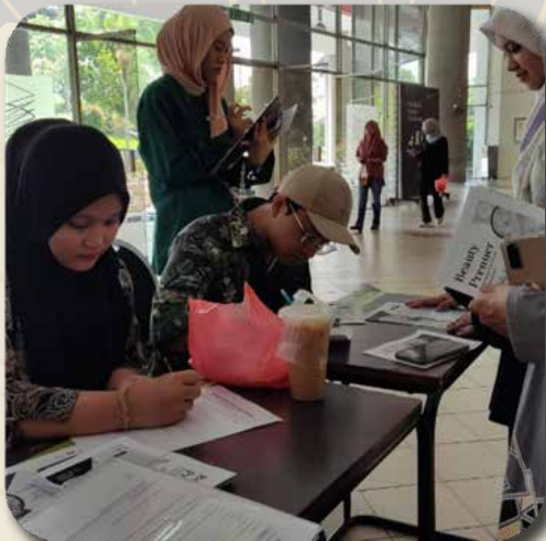
Reach out di Fakulti Seni Kreatif