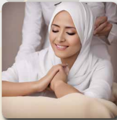
4) Muslimah Hair Cut and Hair Spa