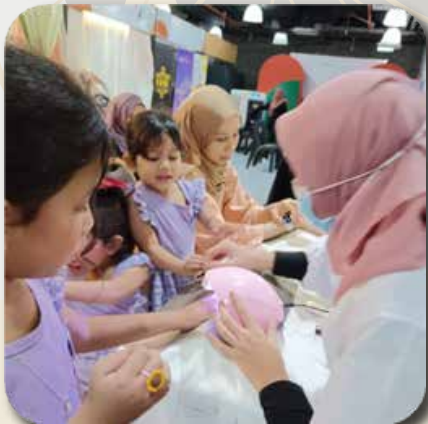
3) Manicure & Pedi Spa