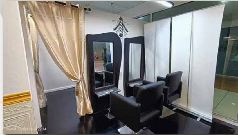
Bilik rawatan rambut lelaki dan wanita