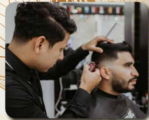
5) Barber and Hair Spa