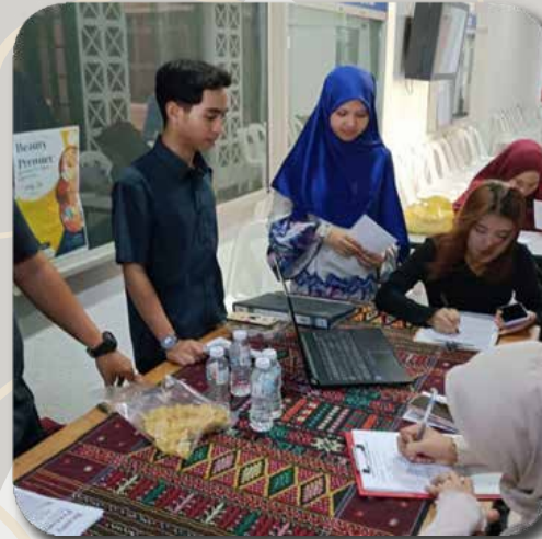
Reach out di MASMED