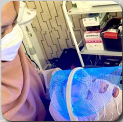
1) Pakej Facial