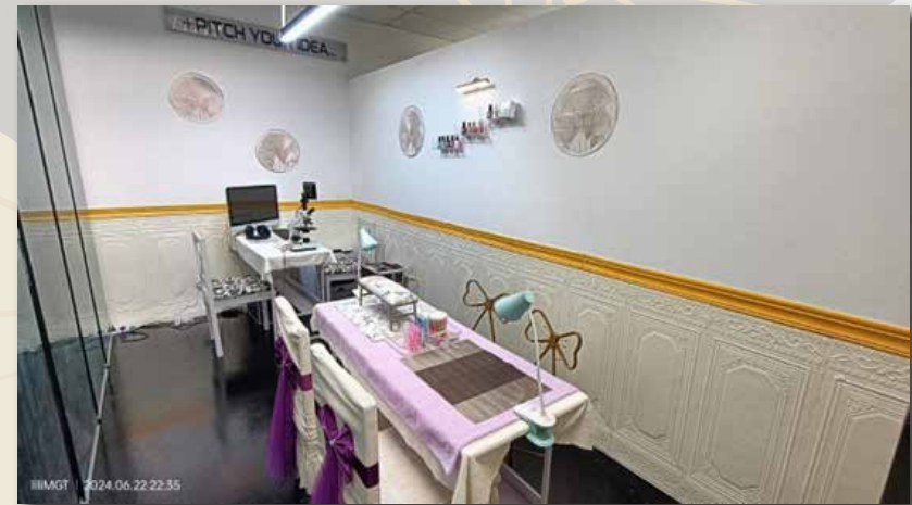
Bilik rawatan kuku