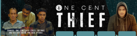
SUMBER: ONE CENT THIEF (2023); BAYTUNES AND RELEASE ORDER FOR EACH EPISODE

Meskipun terdapat syak wasangka bahawa serangan godaman itu dilakukan oleh orang dalam, namun Ketua Pegawai Teknologi Bintang Bank, Irene De Costa telah mengambil sikap menutup sebelah mata bagi menjaga imej dan nama baik bank. Hal ini mencerminkan kegagalan institusi kewangan untuk mematuhi Akta Perkhidmatan Kewangan 2013 atau Akta Perkhidmatan Kewangan Islam 2013, yang mewajibkan audit berkala untuk mengelakkan penyelewengan.