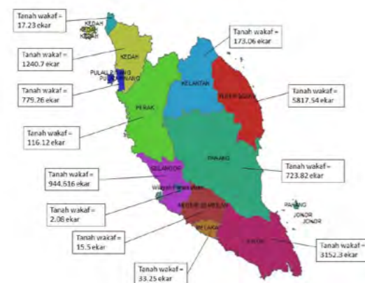
Rajah 1: Taburan Tanah Wakaf di Malaysia

Rajah 1 menunjukkan taburan tanah wakaf di Malaysia. Dengan jumlah keluasan yang besar memerlukan satu sistem maklumat yang canggih bagi memastikan pengurusan tanah wakaf dapat dimanfaatkan sepenuhnya. Ini merangkumi perancangan untuk diurus dan dibangunkan untuk kepentingan dan kemajuan komuniti. Pengurusan harta wakaf melalui sistem maklumat geografi adalah berdasarkan lokasi sebenar tanah wakaf tersebut. Ini memudahkan proses mengurus dan merancang pembangunan yang bakal dijalankan. Selain itu juga, data harta wakaf ini akan dimasukkan ke dalam sistem maklumat ini dan ia akan memudahkan proses pemantauan. Pada masa kini, kesemua harta wakaf masih lagi direkodkan secara manual iaitu dengan cara menyimpan rekod-rekod pewakaf dan tanah wakaf. Proses ini amat rumitkan di mana ia perlu dirujuk kepada fail asal setiap kali berurusan. Manakala, sistem maklumat geografi pula dapat memudahkan kerja pengurusan kerana ia dapat memaparkan segala maklumat mengenai tanah wakaf. Perancangan ke atas tanah wakaf juga dapat dirancang dengan teliti berdasarkan kepada peta lokasi tanah wakaf berkenaan (Amaludin & rakan-rakan, 2011)