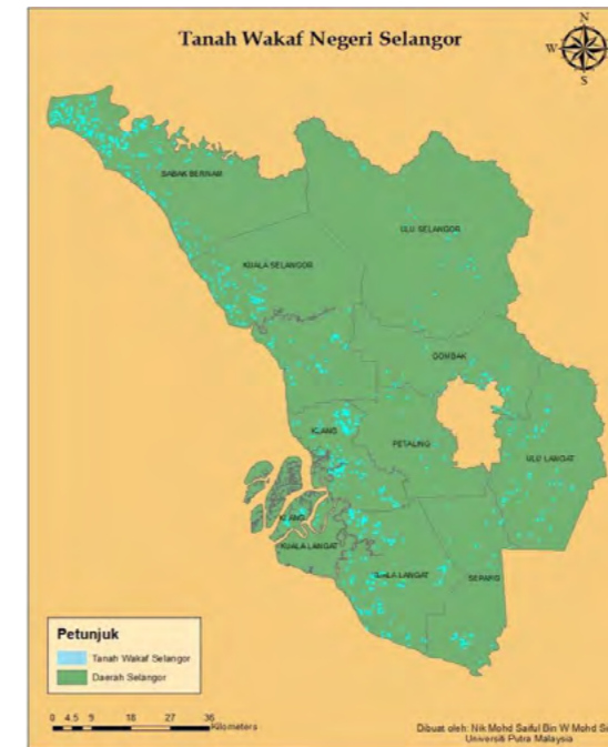
Rajah 2: Peta Tanah Wakaf Selangor

Aplikasi ‘AZAN Geomap’ dibangunkan oleh sekumpulan penyelidik daripada Fakulti Ekologi Manusia, Universiti Putra Malaysia dan telah berjaya mendapat pemfailan Hak Cipta pada tahun 2015. Aplikasi ini dihasilkan berasaskan konsep perisian Geographic Information System (GIS) khusus dalam pengurusan maklumat dan data harta dan tanah wakaf untuk beberapa negeri yang tersedia untuk digunapakai. Keperluan untuk membangunkan dan mengaplikasikan ini memerlukan perkakasan dan peralatan komputer riba, perisian GIS, peralatan Global Positioning System (GPS), peta digital yang disediakan oleh Jabatan Ukur dan Pemetaan Malaysia (JUPEM) serta data-data harta dan tanah wakaf berkaitan. Sistem ini boleh membantu untuk menyimpan pelbagai maklumat yang diperlukan dalam pengurusan harta dan tanah wakaf secara efektif, cepat dan mudah dicapai. Sistem ini dapat merekod pelbagai keperluan dalam pengurusan perancangan dan pemantau harta dan tanah wakaf berasaskan kedudukan yang sebenar. Sistem ini dapat mencari kedudukan yang paling hampir untuk mengesan lokasi harta dan tanah wakaf yang telah direkodkan. Rajah 2 dan 3 menunjukkan hasil peta yang berjaya dihasilkan melalui aplikasi ini di negeri Selangor dan Wilayah Persekutuan Kuala Lumpur.