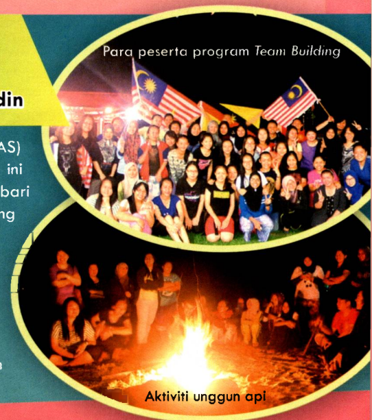
Para peserta program Team Building

Aktiviti ini telah berjalan dengan lancar kerana mampu melahirkan pelajar yang bekerjasama dalam satu pasukan. Di samping itu, program ini juga telah berjaya mewujudkan suasana yang harmoni dan mesra di kalangan pelajar dari semua bahagian serta pensyarah-pensyarah kursus ini melalui aktiviti sukaneka dan aktiviti unggun api.