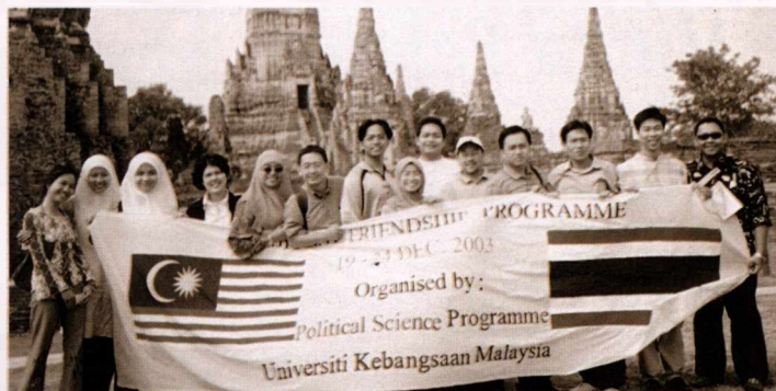
Kapkhonka Thailand! ( Thank you, Thailand )

We had the opportunity to gain first hand knowledge, direct contact and establish network among Malaysian and Thai students and academicians from three universities.