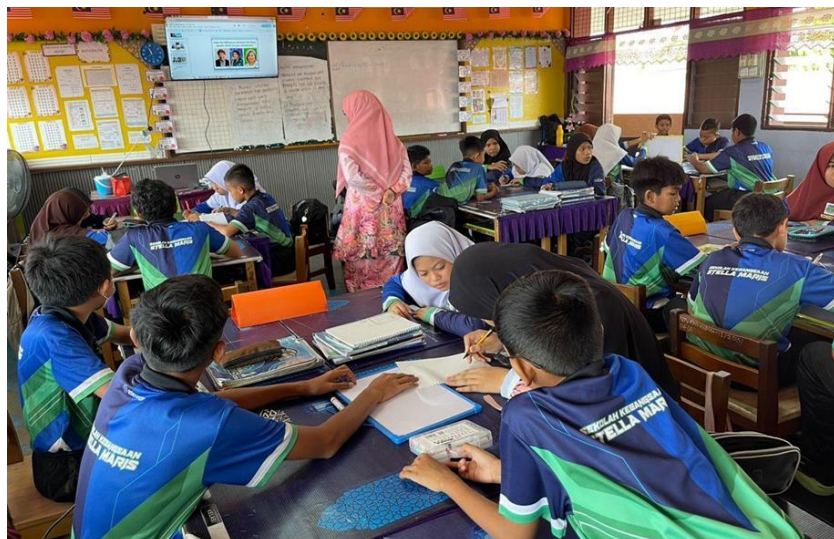
Gambar 2: SRK Stella Maris menggunakan televisyen dalam subjek Bahasa Inggeris

Televisyen menyediakan animasi, gambar rajah, dan simulasi yang menjadikan konsep abstrak lebih nyata dan mudah difahami.