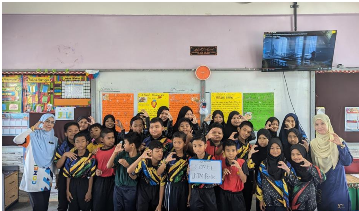
Gambar 3: Televisyen digunakan di SRK Jelempek untuk meningkatkan penglibatan pelajar dalam pembelajaran