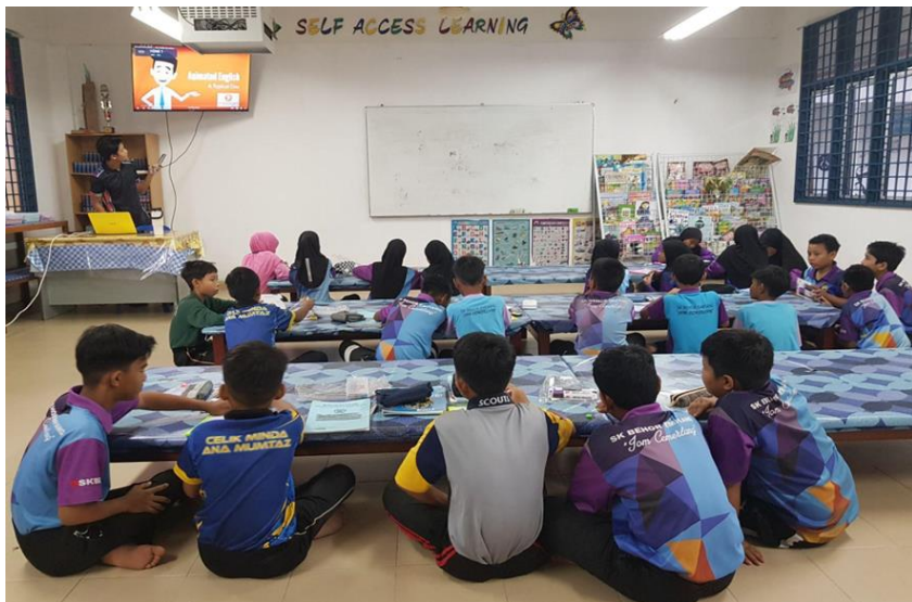
Gambar 1: Televisyen digunakan untuk menyampaikan maklumat secara interaktif di SRK Behor Empiang

Televisyen menawarkan pengalaman pembelajaran pelbagai deria dengan menggabungkan visual, audio, dan teks. Perkara ini boleh memenuhi gaya pembelajaran yang berbeza (visual, auditori, kinestetik) dan membantu pelajar lebih memahami dan mengingat maklumat.