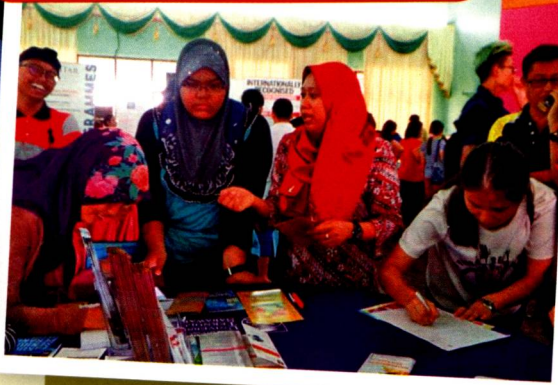
Lokasi 4: Antara lokasi yang paling ramai pengunjung ke kaunter UiTM. Ini kerana di daerah Sarikei ini mempunyai banyak sekolah. Keputusan SPM calon-calon pelajar di sini juga sangat memuaskan dan baik.