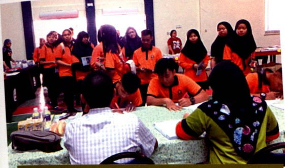
Lokasi 3: Lawatan dari pelajar serta guru sekolah-sekolah sekitar Saratok.