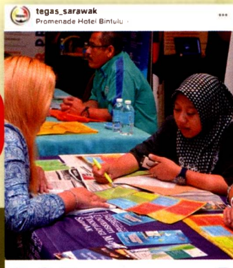
Lokasi 7: Antara lokasi yang mempunyai pengunjung yang ramai

7 likes tegas_sarawak #proDR2017 7th Stop: Bintulu Come and join us today at Promenade Hotel to discover the educational pathway for you!