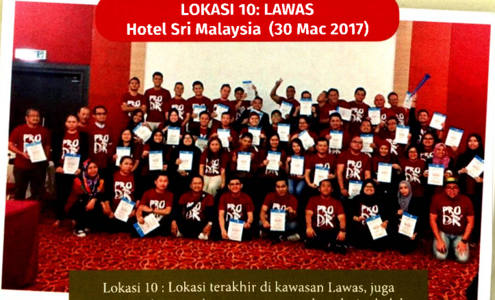
Lokasi 10: Lokasi terakhir di kawasan Lawas, juga mempunyai pengunjung yang memuaskan dari sekolah-sekolah sekitar serta penduduk tempatan.