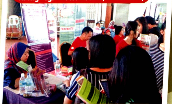
Lokasi 6: Kaunter diadakan di ruang legar bangunan niaga. Antara lokasi yang kurang sesuai kerana panas, sempit serta tidak kondusif.