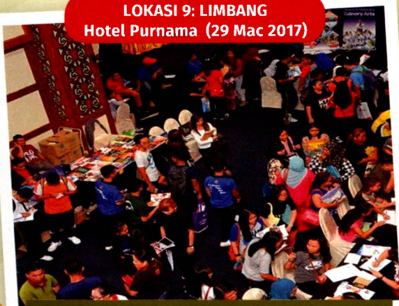
Lokasi 9: Sambutan pengunjung dari kawasan Limbang juga sangat baik.