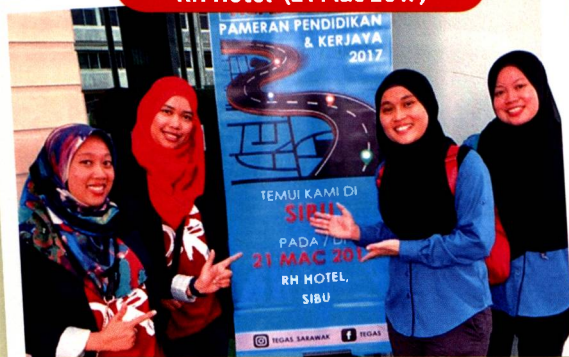
Lokasi 5: Pengunjung di lokasi Sibu juga sangat memberangsangkan. Antara calon yang hadir adalah dari daerah Song, Kapit, Kanowit serta Daro.