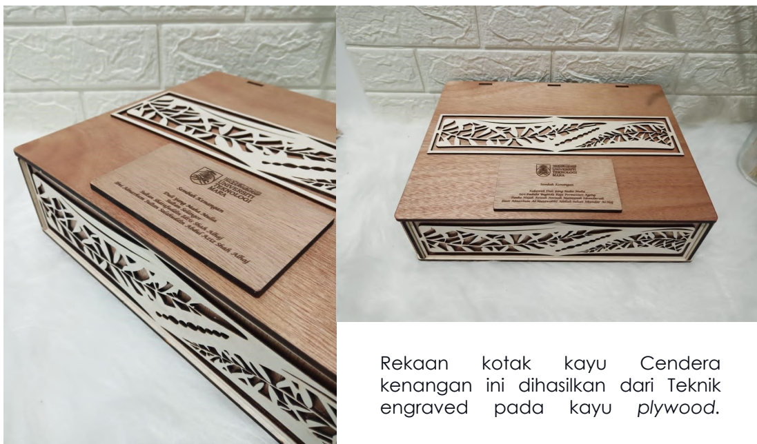
Rekaan kotak kayu Cendera kenangan ini dihasilkan dari Teknik engraved pada kayu plywood.

Cendera kenangan ini telah mendapat perkenan Tuanku Canselor selepas istiadat berlangsung. Harapan Batik Merbok agar terus maju dalam mengembangkan bidang tekstil ini sehingga ke peringkat yang lebih tinggi seterusnya ke peringkat dunia.