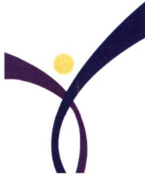
Logo Rasmi | Kumpulan Inovatif & Kreatif Universiti Teknologi MARA

Logo ini mendokong prinsip bahawa KIK adalah salah satu mekanisma pengurusan penting bagi menyemarak value creation untuk menjana kegemilangan UiTM.