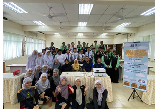
Gambar 2 Pelajar sekolah SMKS3 bersama pelajar FSPPP UiTM Seremban

Aktiviti kedua ialah program literasi maklumat serta bengkel asas bacaan pantas, yang dikendalikan oleh dua pegawai dari PTAR dengan bantuan pelajar UiTM. Program ini melibatkan 30 orang pelajar dari SMK Seremban3.