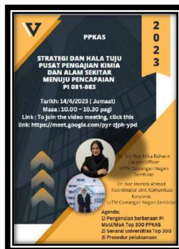
Gambar 1: Poster pembentangan pelan strategik PI 081-083

penerangan secara terperinci berkaitan protokol majlis menandatangani perjanjian.