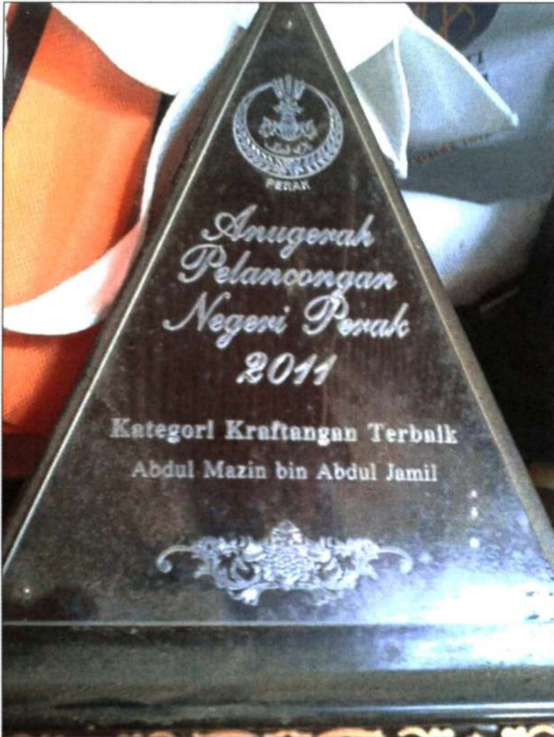
Figure 5 kraftangan terbaik anugerah pelancongan negeri perak 2011