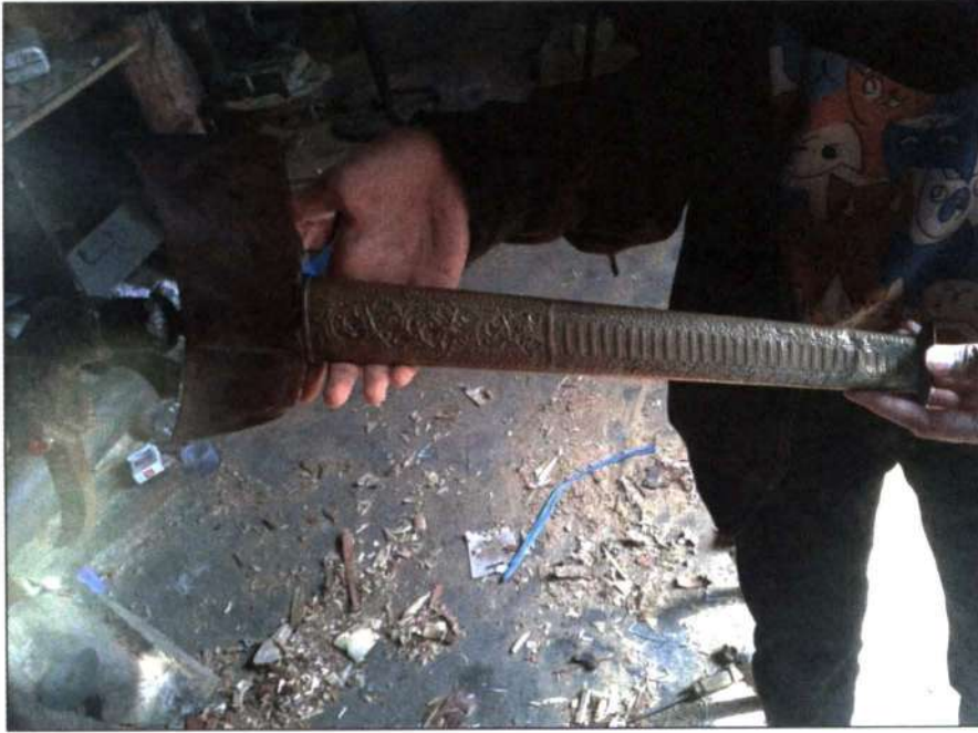
Figure 6 antara keris yang dibuat