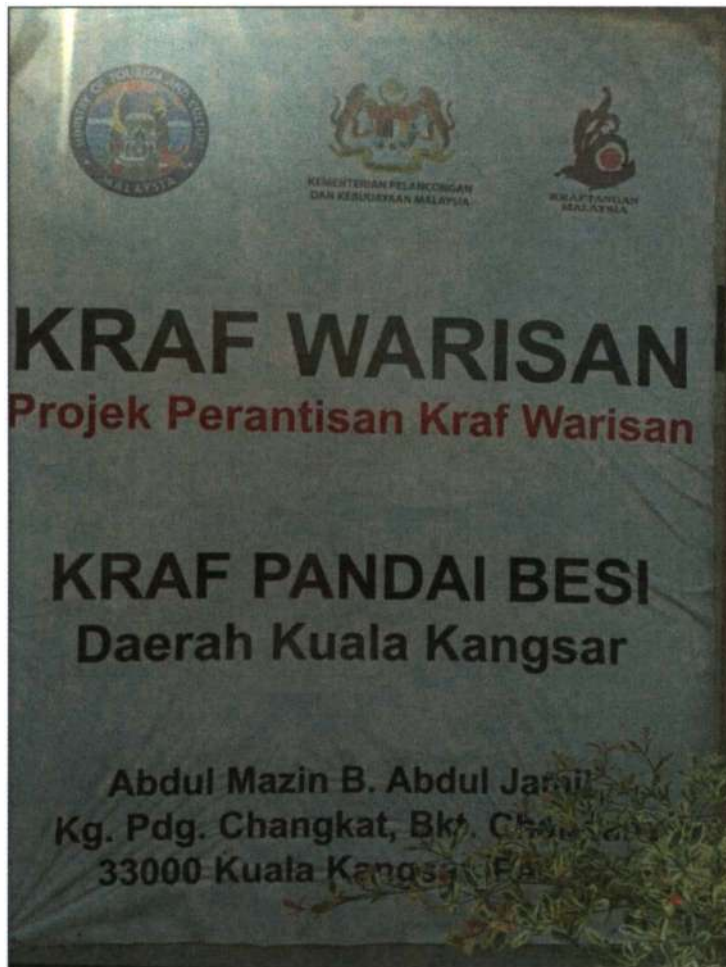
Figure 8 Papan tanda