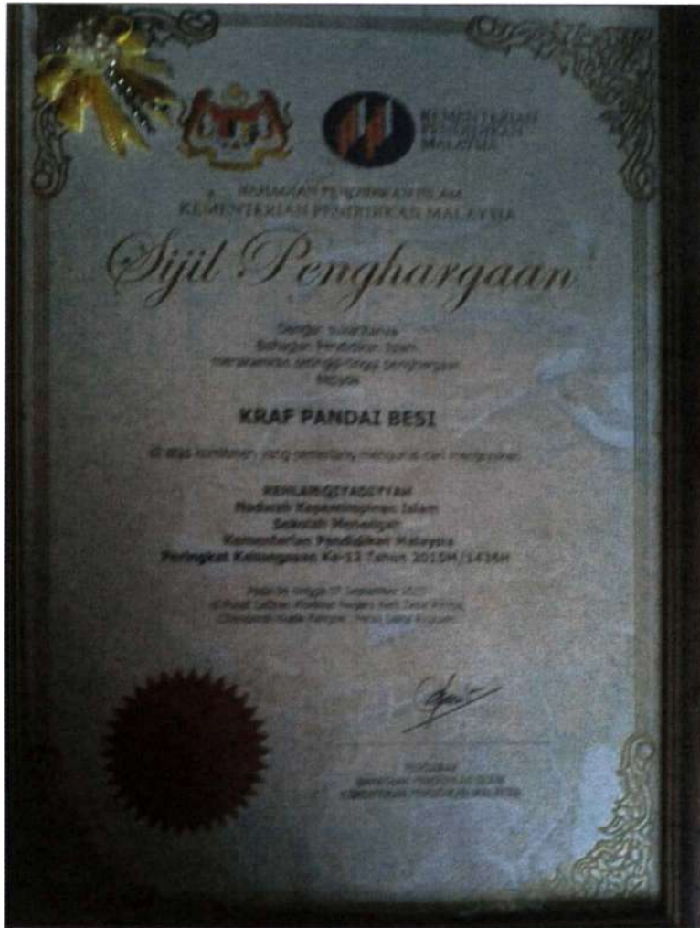
Figure 3 sijil penghargaan penceramah