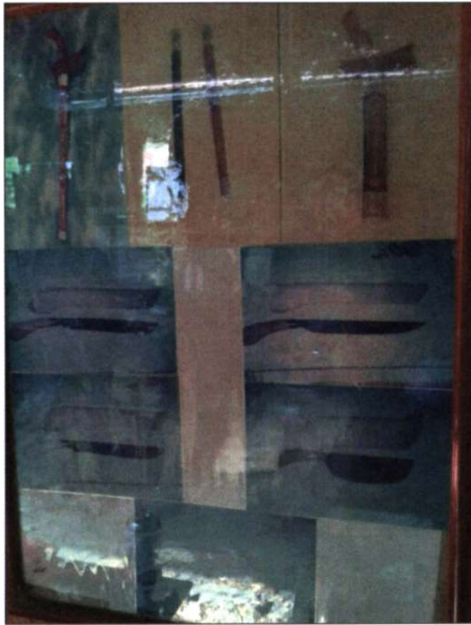
Figure 7 antara senjata yang dibuat