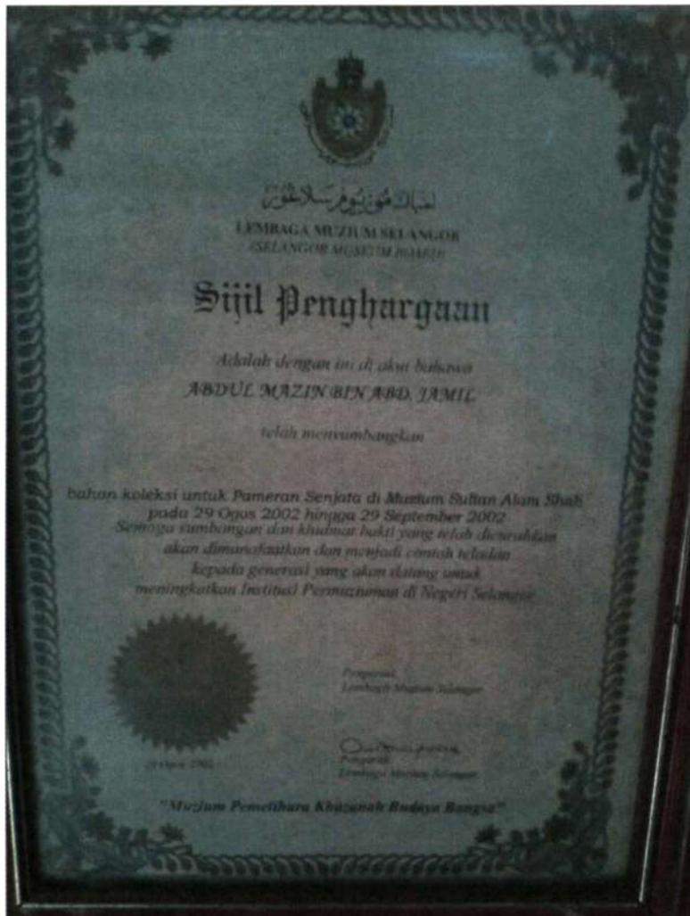
Figure 4 sijil penghargaan menyumbang untuk pameran senjata