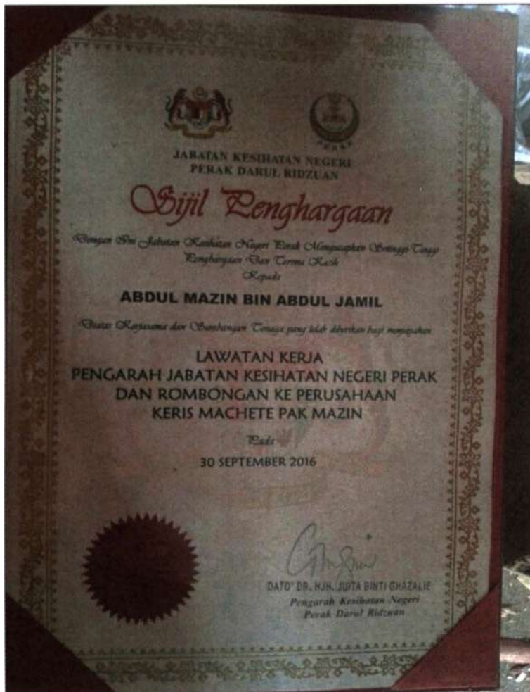
Figure 2 sijil lawatan kerja daripada pelbagai pihak