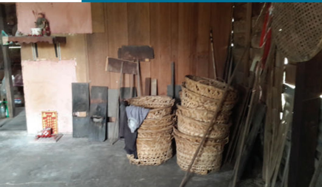
Gambar 8.6: Peralatan yang digunakan untuk memproses buah asam keping