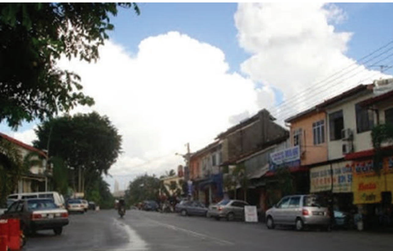
Gambar 8.10: Pemandangan di Pekan Merbok