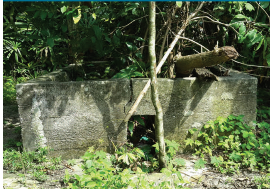
Gambar 8.8: Tempat memanggang isi kelapa

Selepas berakhir musim buah asam, Puan Tan Ah See akan meneruskan kerja dengan memproses isi kelapa kering. Kelapa kering ini akan diproses untuk dijadikan minyak kelapa. Hal ini adalah kerana pada zaman tersebut, minyak kelapa sawit masih belum wujud. Menurut Lim (temubual peribadi, 27 September 2014), keluarga beliau telah memulakan perniagaan menjual kelapa kering setelah ayahnya menjual ladang getah sebanyak 60 hektar di Pulau Pinang pada tahun 1956. Setiap minggu, sebanyak dua buah lori yang mengangkut kelapa kering akan dihantar ke Pulau Pinang untuk dijual kepada Encik Yeap Chor Ee, seorang tauke kaya di sana. Kini, Puan Tan Ah See dan Encik Lim Ah Kik tidak lagi mengusahakan perniagaan buah asam dan kelapa kering. Walaupun masing-masing telah berusia, Puan Tan Ah See masih mengusahakan tanaman padi manakala Encik Lim Ah Kik menjual sayur.