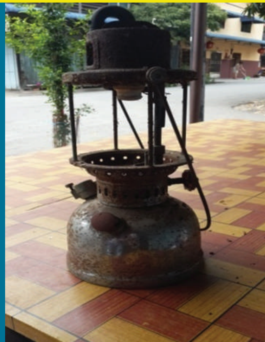
Gambar 8.2: Lampu minyak tanah yang digunakan sebelum tahun 1976