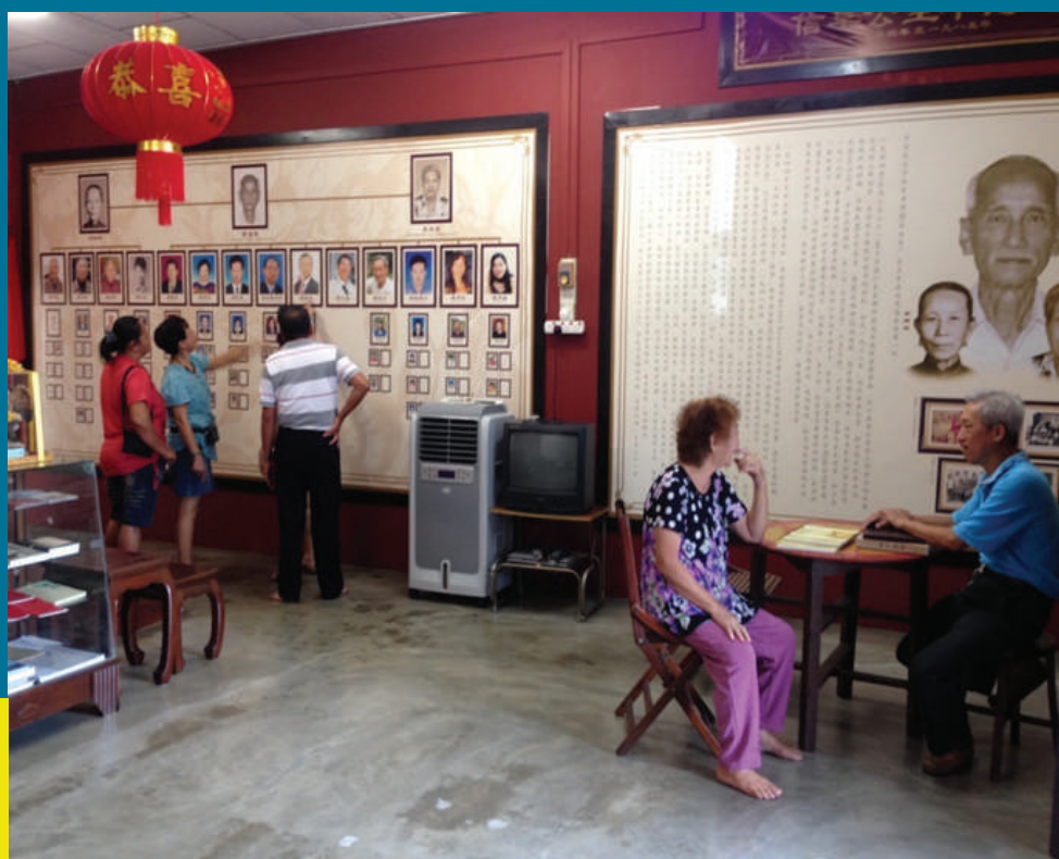
Gambar 8.20: Galeri Keluarga Lee sentiasa menerima kunjungan pelawat termasuklah pelawat luar dari Kedah

Maklumat lanjut berkaitan Galeri Keluarga Lee ini boleh didapati di laman web lemerbok.com .