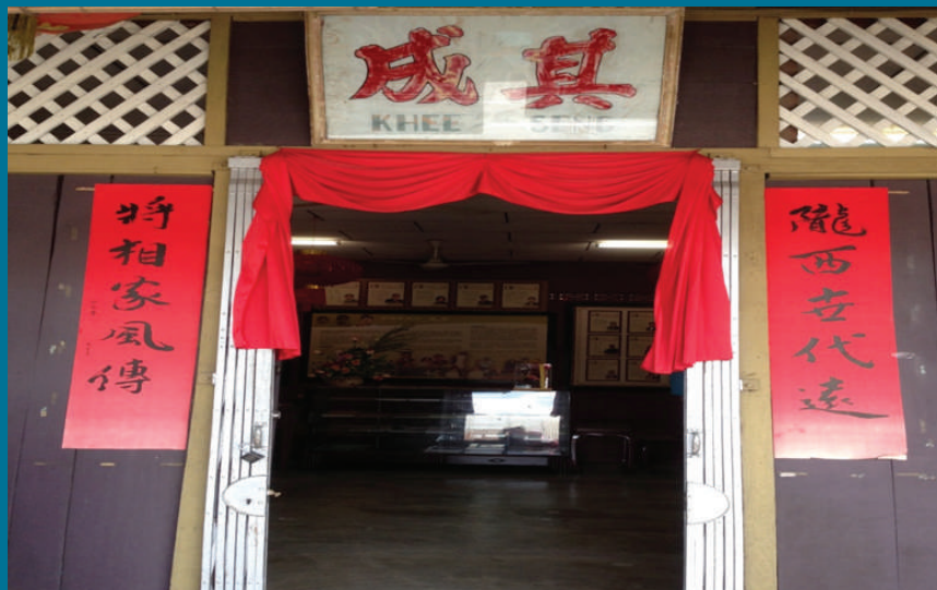
Gambar 8.16: Galeri Keluarga Lee di Pekan Merbok

Galeri Keluarga Lee telah ditubuhkan pada tahun 2009 bagi menunaikan hasrat mendiang Dato' Lee. Mendiang Dato' Lee pernah berhasrat untuk membuka sebuah galeri yang dapat menempatkan maklumat Keluarga Lee supaya generasi muda Keluarga Lee dapat mengetahui genealogi keluarga mereka. Justeru, bagi menunaikan hasrat dan mengenangkan jasa serta sumbangan mendiang Dato' Lee terhadap bidang pendidikan dan masyarakat Cina, galeri ini telah ditubuhkan oleh adik-beradik mendiang di rumah lama keluarga mereka di alamat 14, Pekan Lama Merbok. Proses pembinaan galeri ini menelan belanja sekitar RM20,000 dan mengambil masa selama setahun untuk menyiapkannya. Galeri ini menempatkan pelbagai maklumat termasuklah kisah perjalanan hidup beliau sepanjang 56 tahun dan juga buku genealogi Keluarga Lee.