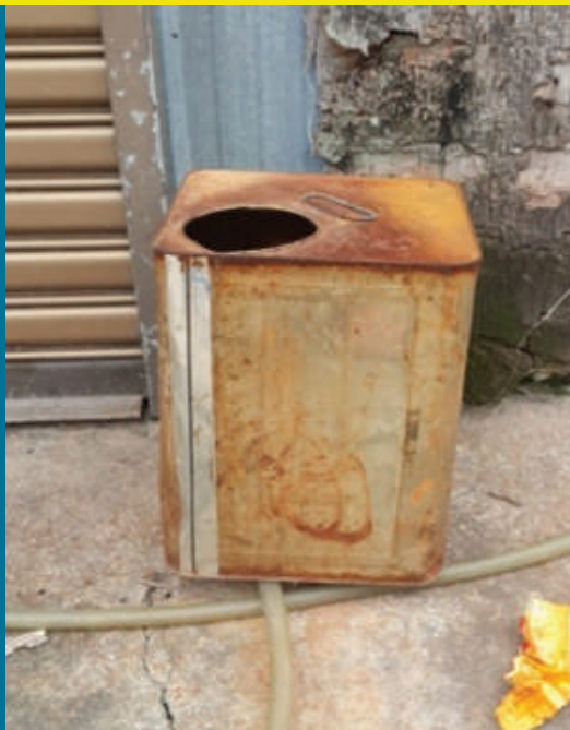
Gambar 8.1: Contoh tin minyak yang digunakan sebagai tandas harian mereka

Pada zaman jajahan Inggeris, pembelian barang keperluan seperti beras adalah dengan menggunakan kupon. Sebelum tahun 1954, para penduduk menggali telaga bagi keperluan bekalan air. Menurut Liew (temubual peribadi, 27 September 2014), terdapat sebahagian penduduk mengupah orang kampung untuk menggali telaga dengan bayaran sebanyak 60 sen bagi telaga yang bersaiz 1 meter lebar dan 2 meter dalam. Berbanding dengan zaman sekarang yang menggunakan jentolak pengkaut untuk menggali telaga, mereka hanya menggunakan cangkul untuk menggali telaga. Bagi kemudahan bekalan elektrik pula, kebanyakan rumah penduduk menggunakan lampu minyak tanah manakala bagi sistem pembuangan najis pula, penduduk pada zaman tersebut hanya menggunakan tin minyak yang ditebuk untuk dijadikan mangkuk tandas. Kampung Baru Merbok hanya mempunyai bekalan elektrik pada tahun 1976. Dari segi pengangkutan pula, para penduduk kebanyakannya menggunakan basikal ataupun berjalan kaki. Penggunaan motosikal hanya bermula pada tahun 1960 selepas diperkenalkan oleh seorang tauke kaya Cina, iaitu Encik Lok Boon Siew.