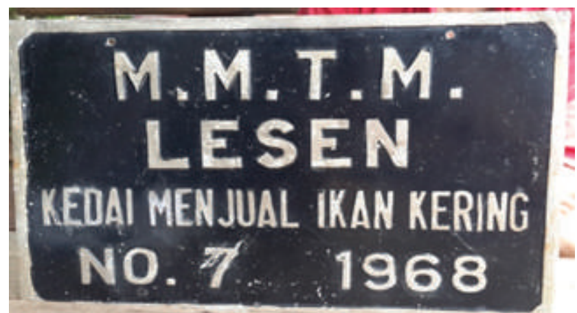
Gambar 8.9: Lesen perniagaan pada tahun 1968

“Faktor penolak seperti keadaan politik dan sosial di negara China merupakan punca utama penghijrahan beramai-ramai kaum Cina terutamanya dari wilayah China Selatan seperti Guangdong, Guangxi dan Fujian ke Tanah Melayu sehingga sanggup meninggalkan isteri dan anak-anak.”