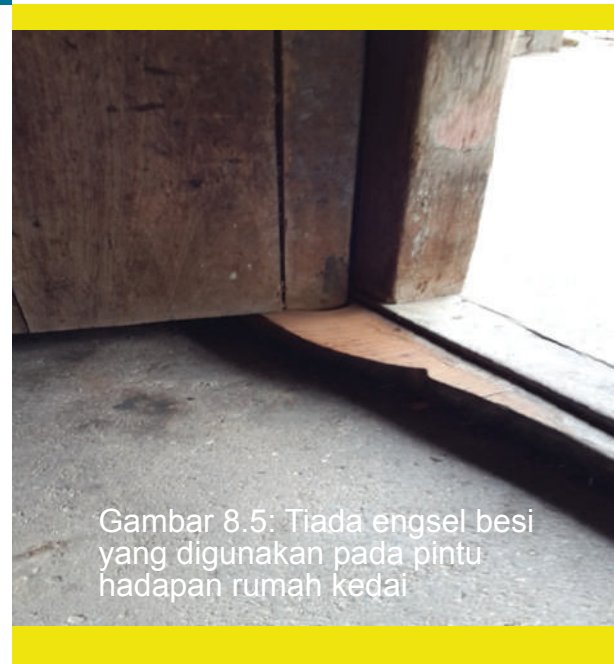
Gambar 8.5: Tiada engsel besi yang digunakan pada pintu hadapan rumah kedai

Menurut beliau, bulan Mac dan April merupakan musim buah asam pada setiap tahun. Justeru, ramai penduduk termasuk beliau akan mula memproses buah asam pada bulan Mei sehinggalah Ogos setiap tahun. Buah asam akan dipotong dan dijemur di tempat lapang. Tinjauan penulis ke dalam rumah kedai tersebut mendapati masih terdapat peralatan lama yang digunakan untuk tujuan pemrosesan buah asam keping.