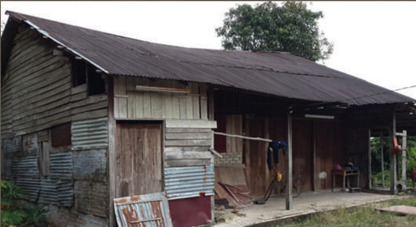
Gambar 8.4: Rumah kedai warisan keluarga milik Puan Tan Ah See

Pada zaman dahulu, kegiatan ekonomi penduduk Cina di sini adalah berniaga dan memasarkan produk hasil tempatan. Antara barangan keluaran penduduk tempatan ialah asam keping, buah pinang dan isi kelapa kering yang dijual untuk pemrosesan minyak kelapa. Tinjauan penulis di sekitar Pekan Lama Merbok mendapati wujud sebuah rumah kedai lama yang suatu ketika dahulu pernah menjadi tempat memproses dan menjual asam keping. Rumah kedai lama ini milik Puan Tan Ah See. Beliau yang kini berusia 74 tahun menyatakan bahawa rumah kedai tersebut dianggarkan telah berusia 60-70 tahun. Perkara ini dapat dibuktikan apabila tiada engsel besi yang digunakan pada pintu rumah kedai tersebut sepertimana engsel pintu rumah kayu pada zaman sekarang.