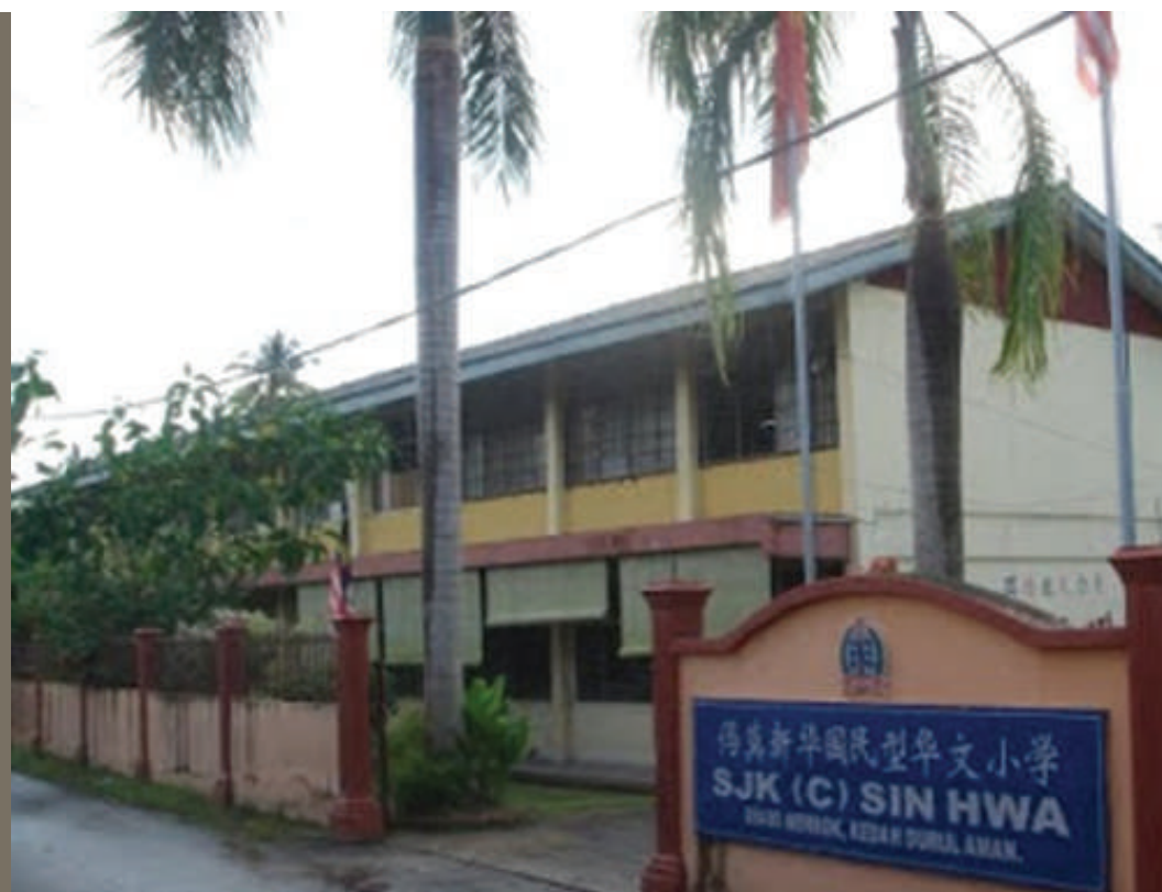
Gambar 8.11: Gabungan daripada dua buah sekolah pendidikan Cina menjadi SJK (C) Sin Hwa

Kaum Cina amat mementingkan pendidikan. Berpegangkan kepada prinsip 'biar miskin kehidupan, jangan miskin pendidikan', penubuhan sekolah pendidikan Cina merupakan perkara pertama yang dilakukan setelah mereka sampai di Tanah Melayu. Sekolah Rendah Jenis Kebangsaan Cina Sin Hwa merupakan satu-satunya sekolah rendah pendidikan Cina yang masih kekal sehingga sekarang di Pekan Merbok. Sekolah ini telah ditubuhkan pada tahun 1946, hasil daripada gabungan dua buah sekolah pendidikan Cina, iaitu Sekolah Zhen Hwa dan Sekolah Pei Hwa.