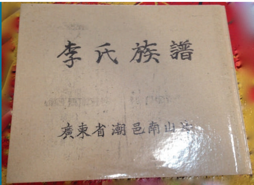
Gambar 8.18: Buku genealogi Keluarga Lee