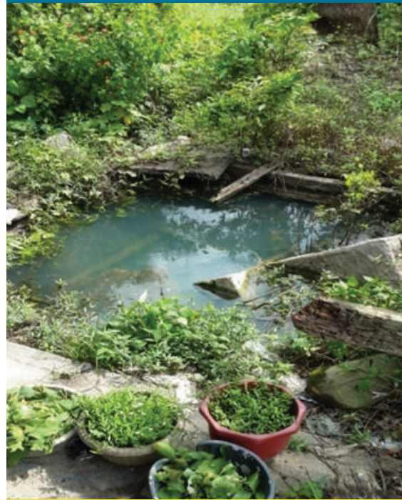
Gambar 8.3: Perigi yang pernah digunakan pada zaman dahulu masih digunakan lagi oleh pemilik asal