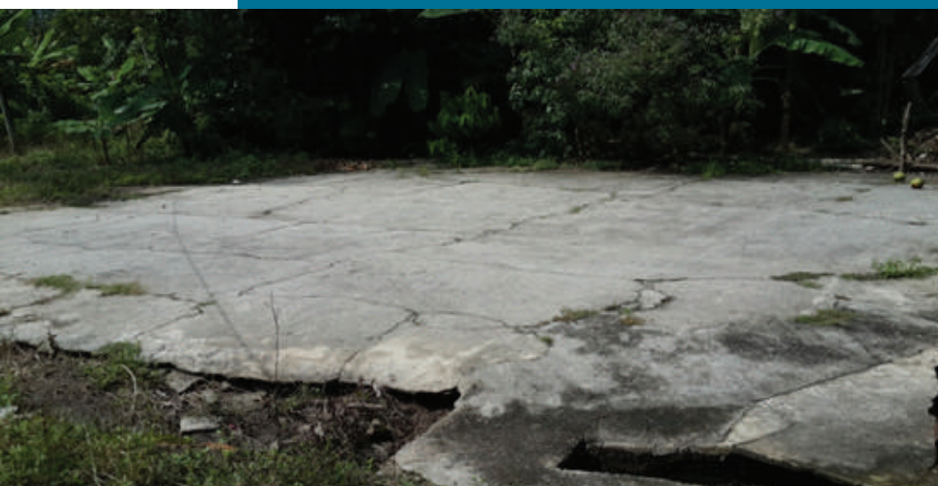
Gambar 8.7: Tempat menjemur asam keping