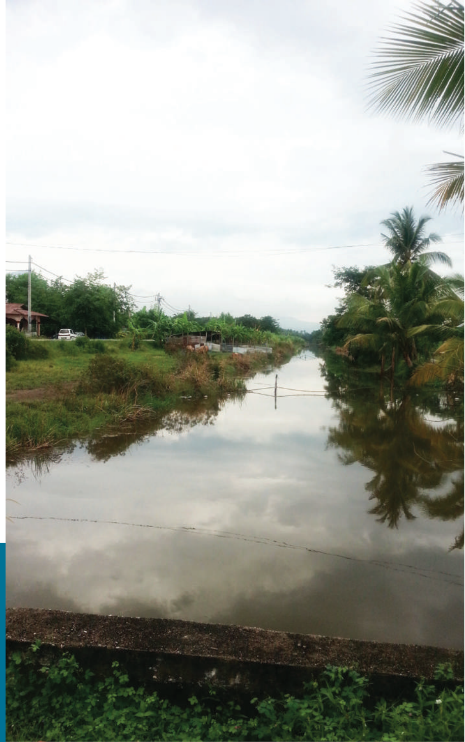
Gambar 4.1: Tali air Projek Ban Merbok

Setelah melalui prosedur yang ditetapkan oleh Jabatan Pengairan dan Saliran, maka mereka yang layak telah diberi sebidang tanah untuk dibangunkan sebagai kawasan penempatan dan pertanian. Maka bermulalah hidup mereka sebagai peneroka di Segantang Garam. Memandangkan Tanah Melayu pada masa itu baru enam tahun mengecapi nikmat kemerdekaan, kerajaan pada ketika itu belum mampu untuk menyediakan kemudahan elaun dan peralatan memugar tanah kepada peneroka. Hanya tulang empat kerat menjadi nadi kekuatan mereka untuk terus berusaha.