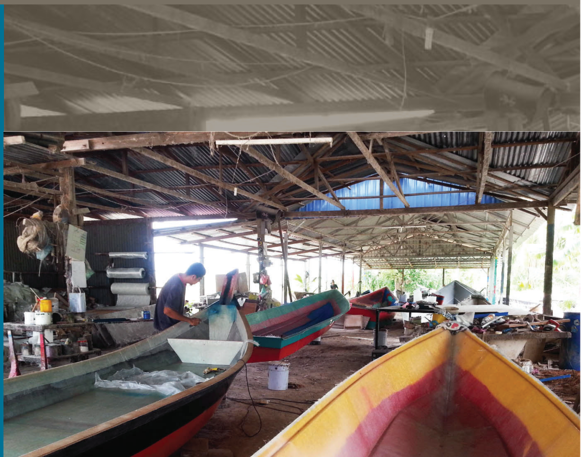
Gambar 4.11: Pekerja En Ali sedang mengecat bot fiber

“ Bot fiber En Ali mendapat tempahan dari dalam dan juga luar negara dan menjadi sumber ekonomi penduduk kampung yang bekerja dengan beliau.”