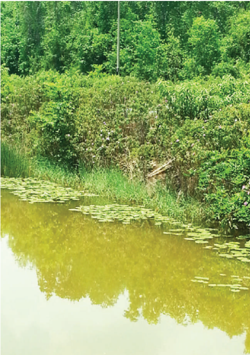
Gambar 4.2:Tali air daripada Projek Ban Merbok sekarang yang khidmatnya masih diperlukan

“ Pengusaha Projek Ban Merbok menjalankan tebus guna tanah paya yang bersaiz lima relung hanya menggunakan cangkul dan kapak, tanpa bantuan apa-apa jentera.”