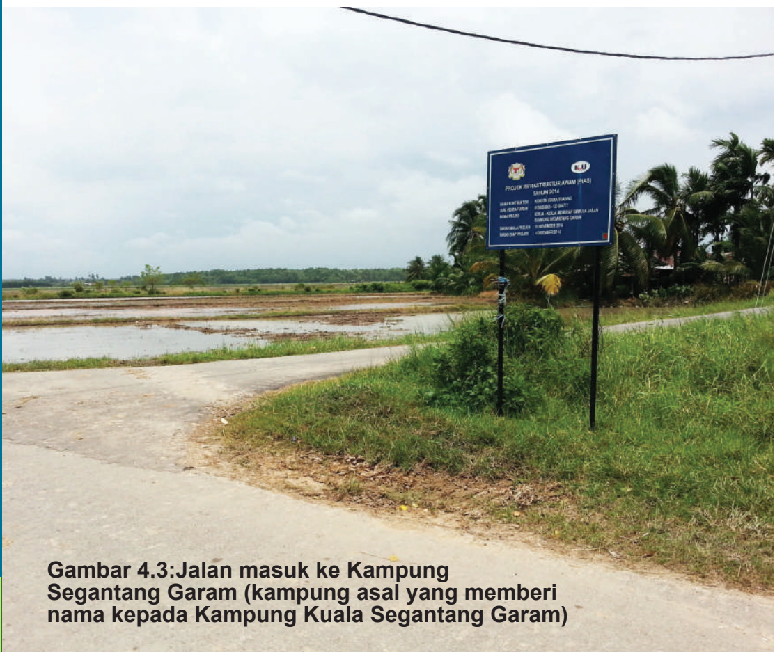
Gambar 4.3:Jalan masuk ke Kampung Segantang Garam (kampung asal yang memberi nama kepada Kampung Kuala Segantang Garam)

Ada kisah menarik tentang kampung ini pada zaman sebelum ada jalan yang dibina untuk menghubungkan kampung ini dengan dunia luar. Memandangkan kurangnya kemudahan asas pada ketika itu, penduduk kampung akan ke Pekan Sungai Petani yang jaraknya agak jauh untuk membeli barang keperluan. Dikatakan oleh orang kampung kerana terlalu sukar untuk ke Pekan Sungai Petani, maka penduduk kampung di situ membeli garam sebanyak segantang sebagai bekal bahan memasak mereka kerana amat jarang mereka mendapat peluang untuk keluar ke pekan.