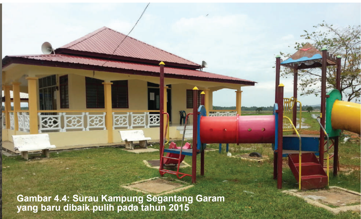
Gambar 4.4: Surau Kampung Segantang Garam yang baru dibaik pulih pada tahun 2015