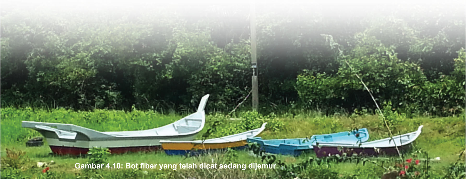
Gambar 4.10: Bot fiber yang telah dicat sedang dijemur

Selain itu, terdapat juga projek pembuatan bot fiber yang dijalankan oleh En Ali bin Din @ Wahab. Bot fiber yang dihasilkan oleh En Ali dan pekerjaanya dipasarkan ke seluruh pelosok tanah air dan juga luar negara bergantung kepada permintaan. Kegiatan ekonomi ini juga sedikit sebanyak telah membantu penduduk kampung meningkatkan tahap ekonomi mereka.