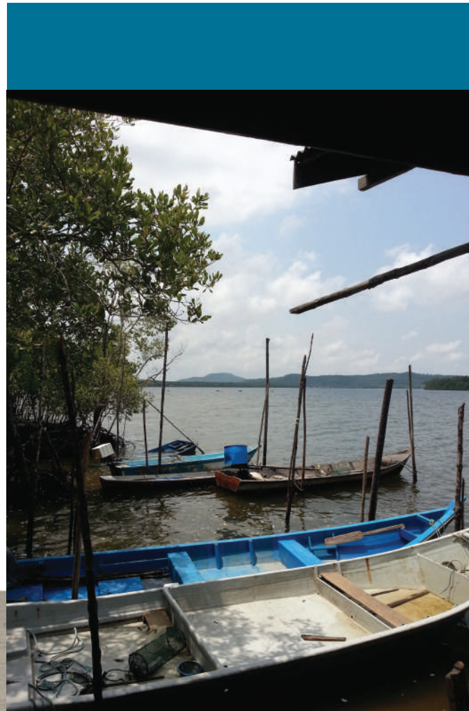
Gambar 4.5: Kampung Kuala Segantang Garam yang indah bersebelahan Sungai Merbok

Setelah sekian lama berlalu, kini Projek Ban Merbok telah memberikan kesejahteraan buat Wahab sekeluarga serta generasi seterusnya. Wahab juga telah dapat memberikan ruang berteduh serta keselesaan buat isteri dan anak-anaknya. Mereka mampu memiliki tanah dan rumah hasil daripada peranan kerajaan yang sentiasa berusaha untuk memajukan dan meningkatkan taraf hidup rakyatnya.