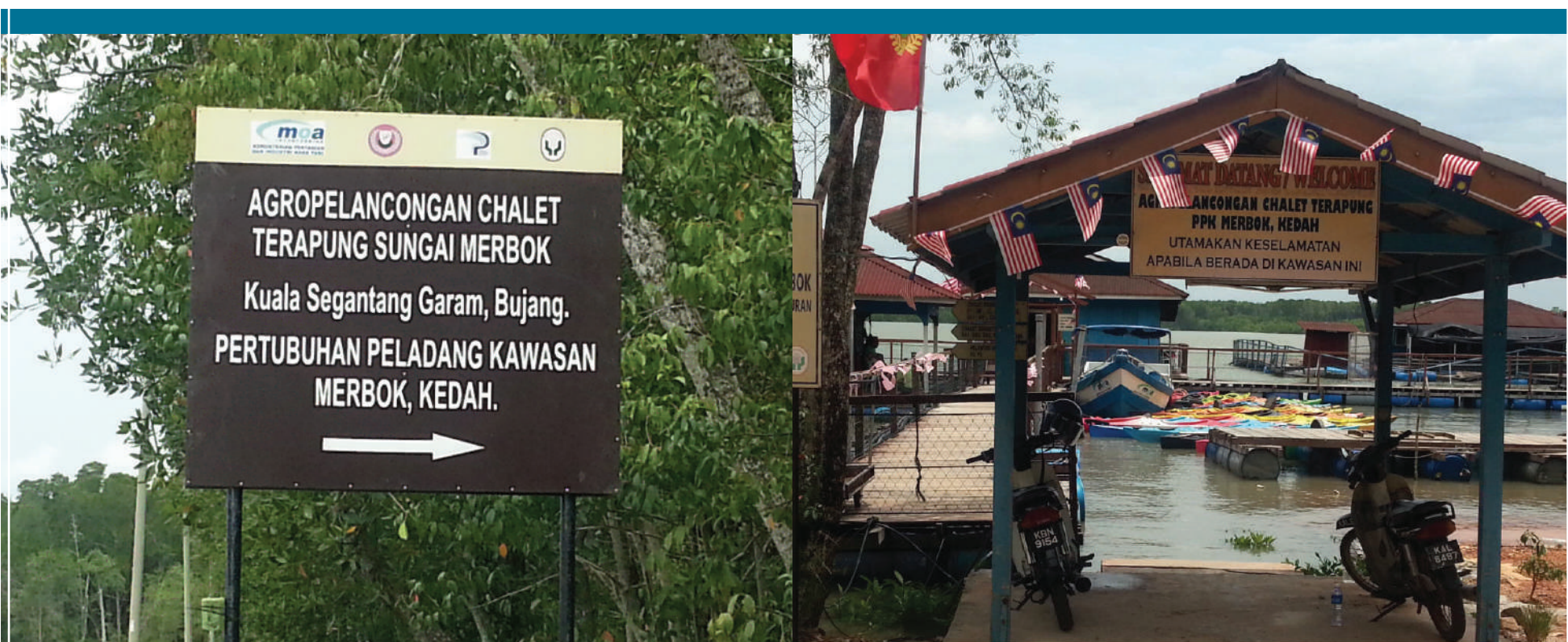
Gambar 4.6: Papan tanda ke Chalet Terapung Kuala Segantang Garam

Kuala Segantang Garam kini merupakan sebuah kampung yang permai dan harmoni. Kegiatan ekonomi utama masyarakat kampung adalah sebagai petani dan nelayan. Walau bagaimanapun, satu projek utama yang telah berjaya menjadikan Kampung Kuala Segantang Garam sebagai tumpuan orang ramai atau pusat percutian adalah Projek Chalet Terapung Kuala Segantang Garam yang diusahakan oleh Pertubuhan Peladang Kawasan Merbok. Chalet Terapung ini terkenal kerana terletak jauh dari hiruk-pikuk kawasan bandar. Selain itu, chalet ini juga popular di kalangan mereka yang suka memancing kerana kedudukan chalet yang terletak betul-betul di atas air memudahkan para peminat aktiviti memancing untuk menjalankan aktiviti mereka.