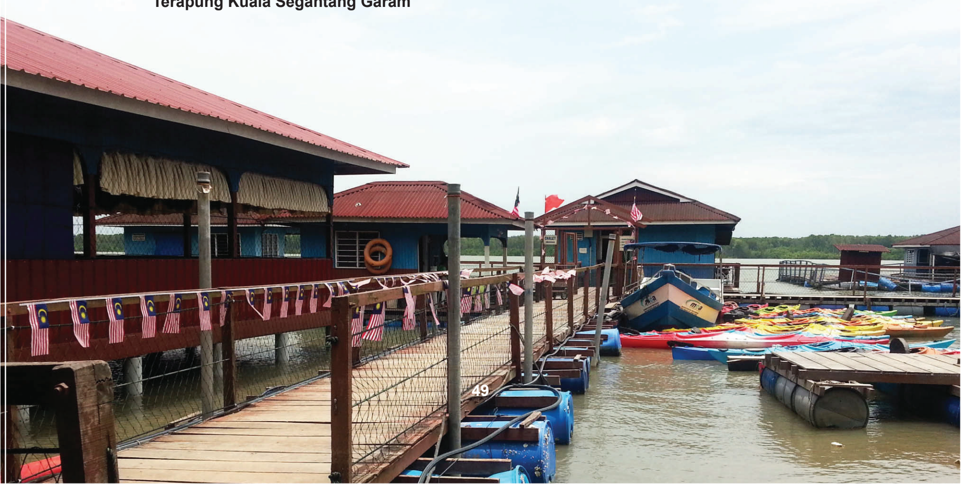
Gambar 4.7: Pintu masuk ke chalet