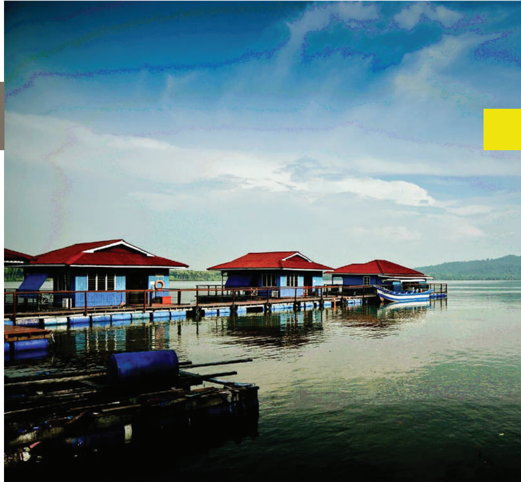
Gambar 3.8: Chalet terapung di Segantang Garam