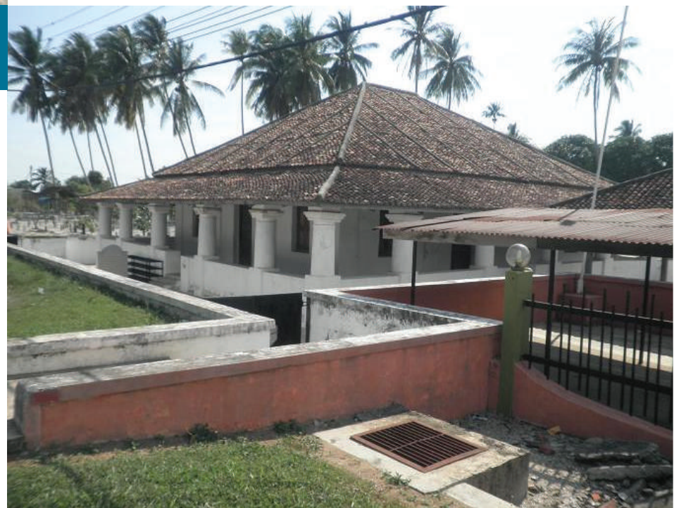
Gambar 3.11: Masjid Lama, Pengkalan Kakap yang dibina pada 1800 Masihi

Tidak mustahil jika satu ketika dahulu Pengkalan Kakap menjadi pusat perdagangan kerana jika dilihat secara fizikal, kawasan tersebut berpasir seperti pasir pantai. Ada juga catatan yang mengatakan pedagang-pedagang pada zaman dahulu menjadikan Pengkalan Kakap sebagai pusat pemunggaan barang-barang dagangan sebelum dibawa ke bukit Aceh dan Kampung Hulu. Asal usul nama Pengkalan Kakap yang terkenal dengan salah satu Masjid tertua di Negeri Kedah masih menjadi misteri. Ada yang mengatakan namanya berasal daripada ikan siakap yang boleh ditemui dengan banyak di sungai Merbok. Ada juga yang mengatakan bahawa nama ini berasal daripada perkataan kakap yang bermaksud berzanji atau menyanyi.