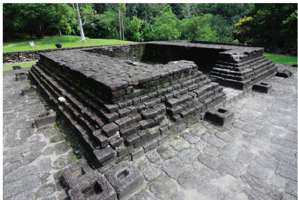
Gambar 3.13: Candi, Lembah Bujang

“Tahukah anda teknologi melebur besi telah dijalankan oleh nenek moyang kita seawal kurun pertama di Sungai Batu Besi?”