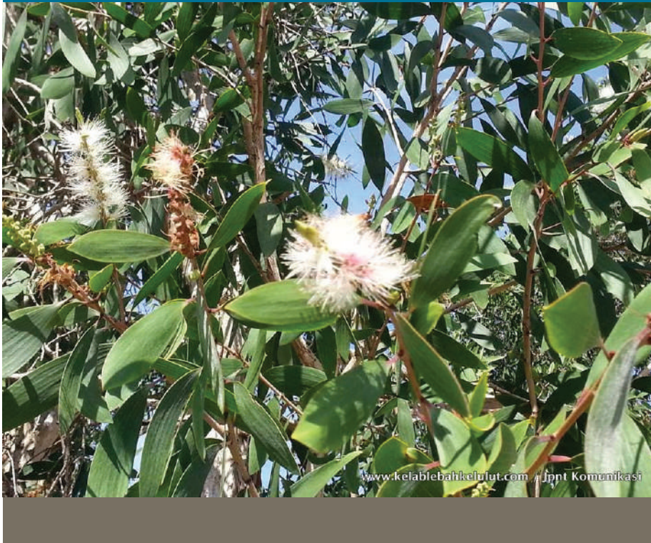
Gambar 3.6: Pokok Gelam

Sungai Pial adalah satu lagi nama kampung di DUN Tanjung Dawai yang berasaskan tumbuhan. Uniknya, sekiranya orang luar datang dan bertanya dimanakah Kampung Sungai Pial, berkemungkinan ada penduduk tempatan yang tidak mengenalinya kerana dalam loghat Kedah perkataan pial disebut dengan sebutan “pe” (seperti “pear” dalam bahasa Inggeris). Perkataan pial ini berasal daripada sejenis tumbuhan renek yang banyak tumbuh di semak samun dan hutan paya di kawasan tersebut. Pucuk pokok pial digunakan oleh penduduk kampung sebagai ulam-ulaman dalam juadah harian. Menurut penduduk kampung tersebut, pokok pial bersifat dua alam kerana mampu hidup dalam kawasan berair masin mahupun tawar. Tegar semangat dan ketabahan pokok pial serta kemampuannya menyesuaikan diri untuk hidup dalam keadaan air yang berbeza ini menjadi inspirasi kepada penduduk kampung untuk gigih berusaha dan cecal menghadapi pelbagai cabaran hidup setegar dan setabah pokok Pial yang tetap kuat bertahan walaupun akarnya terendam di dalam air.