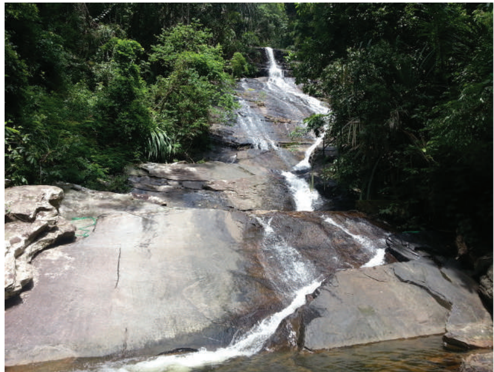
Gambar 3.12: Air Terjun, Batu Hampar

Satu lagi faktor geografi yang mempengaruhi nama sesebuah tempat ialah ciri-ciri fizikal tempat tersebut. Salah satunya ialah nama Batu Hampar. Nama Batu Hampar diperoleh daripada batu besar yang kelihatan seperti terhampar di kawasan Lembah Bujang manakala nama Batu Pahat yang terkenal dengan candinya mendapat namanya kerana di sekitar tebing-tebing sungai tersebut terdapat batu-batu yang telah dipahat tetapi belum digunakan untuk membina candi. Selain itu juga, terdapat bekas-bekas mata pahat pada permukaan batu-batu tersebut (Lembah Bujang Entrepot Kedah terbilang, 1980). Di situlah, bermulanya pemberian nama Batu Pahat di kawasan tersebut.