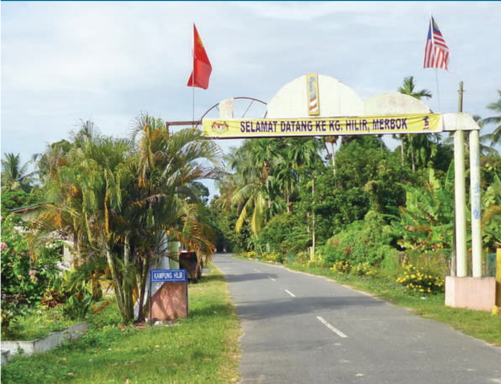
Gambar 3.10: Kampung Hilir, Merbok

Kampung Hilir yang terletak di mukim Merbok mendapat nama daripada kedudukannya di hilir Sungai Merbok. Menurut penduduk kampung yang ditemu bual, pada zaman dahulu, kapal-kapal boleh melayari Sungai Merbok melalui Pengkalan Kakap hinggalah ke Kampung Hilir. Dengan kelebaran hampir 1 km di sesetengah tempat sungai ini menjadi laluan mudah bagi kapal-kapal layar yang besar di zaman dahulu untuk mudik ke hulu. Yang pasti, Sungai Merbok menyimpan seribu misteri sejarah negara dengan berlatarbelakangkan Gunung Jerai yang juga mempunyai kisah legenda yang tersendiri.