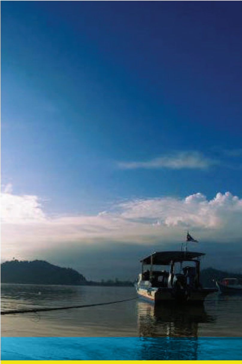
Gambar 3.1: Tanjung Dawai