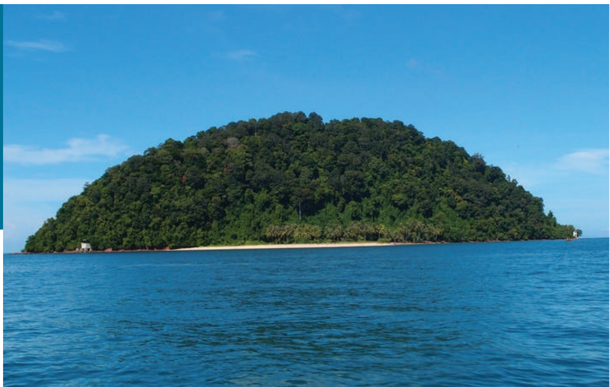
Gambar 3.5: Pulau Songsong, Yan Kedah

Mitos tempatan juga memberi pengaruh kepada nama sesuatu tempat. Menurut cerita nenek moyang dahulu, Pulau Bidan, Pulau Bunting, Pulau Songsong dan Pulau Telor yang terletak di daerah Yan dikatakan adalah berasal daripada manusia yang disumpah oleh Sang Kelembai. Sang Kelembai merupakan gergasi yang menetap di kawasan tersebut. Menurut cerita orang-orang tua, Sang Kelembai menjadi sangat marah akibat tidak dijemput ke majlis melenggang perut kepada seorang wanita yang mengandung. Akibatnya, manusia yang disumpah tersebut telah bertukar menjadi pulau.