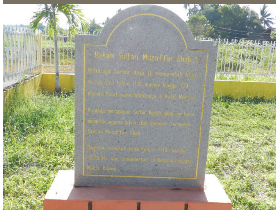
Gambar 3.4: Tertera pada batu penerangan ini: Makam Sultan Muzaffar Shah 1 maharaja Derbar Raja II memerintah Kedah dari tahun 1136M hingga 1179M. Pusat pemerintahannya di Bukit Meriam. Baginda merupakan raja Kedah yang pertama memeluk agama Islam dan menukar namanya menjadi Sultan Muzaffar Shah. Baginda mangkat pada tahun 1179 masehi (175 H) dan dimakamkan di Kampung Langgar, Mukim Bujang.

Pengkalan Bujang yang terletak di Mukim Bujang pula dikenali kerana faktor sejarahnya sebagai pelabuhan entrepot dari penghujung abad ke-11 hingga ke penghujung abad ke-14. Banyak tinggalan sejarah seperti tembikar-tembikar lama dari China, kepingan gelas dari Timur Tengah serta manik-manik dari India dijumpai di kawasan ini. Dipercayai, pada suatu ketika dahulu, kawasan ini merupakan sebuah pelabuhan yang sangat sibuk. Banyak kapal dagang dan pedagang dari merata dunia datang berdagang dan berjual beli di sana.