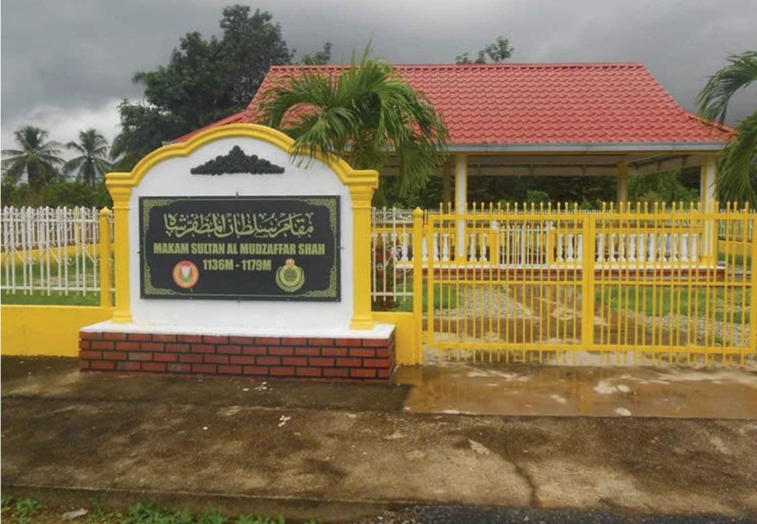
Gambar 3.3: Makam Sultan Muzaffar Shah