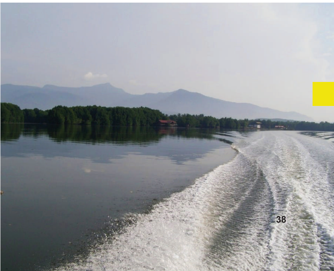
Gambar 3.9: Sungai Merbok

Kedudukan geografi dan lokasi turut menjadi penyumbang kepada asal nama tempat di Dewan Undangan Tanjung Dawai. Salah satunya ialah asal usul nama Sungai Deraka. Menurut cerita nenek moyang dahulu, asal usul nama Sungai Deraka bermula apabila berlakunya tragedi penderhakaan seorang anak kepada ibunya. Walau bagaimanapun, asal usul nama Sungai Deraka sebenarnya, berkait rapat dengan kedudukan geografi dan kejadian alam di tempat tersebut. Kejadian alam seperti air pasang dan surut menjadi menjadi titik permulaan kisah Sungai Deraka. Sungai Deraka merupakan salah satu anak sungai yang mengalir ke Sungai Merbok. Sifat Sungai Deraka yang bertentangan dengan Sungai Merbok menjadi salah satu keunikan dan penyumbang kepada asal nama Sungai Deraka. Keunikan yang ada pada Sungai Deraka adalah apabila Sungai Merbok mengalami air pasang, Sungai Deraka akan mengalami air surut manakala apabila Sungai Merbok berada dalam keadaan air surut, Sungai Deraka pula akan berada dalam keadaan air pasang. Kejadian alam ini menggambarkan seolah-olah berlakunya penderhakaan seorang anak kepada ibunya dan di situlah bermulanya nama "Sungai Deraka".