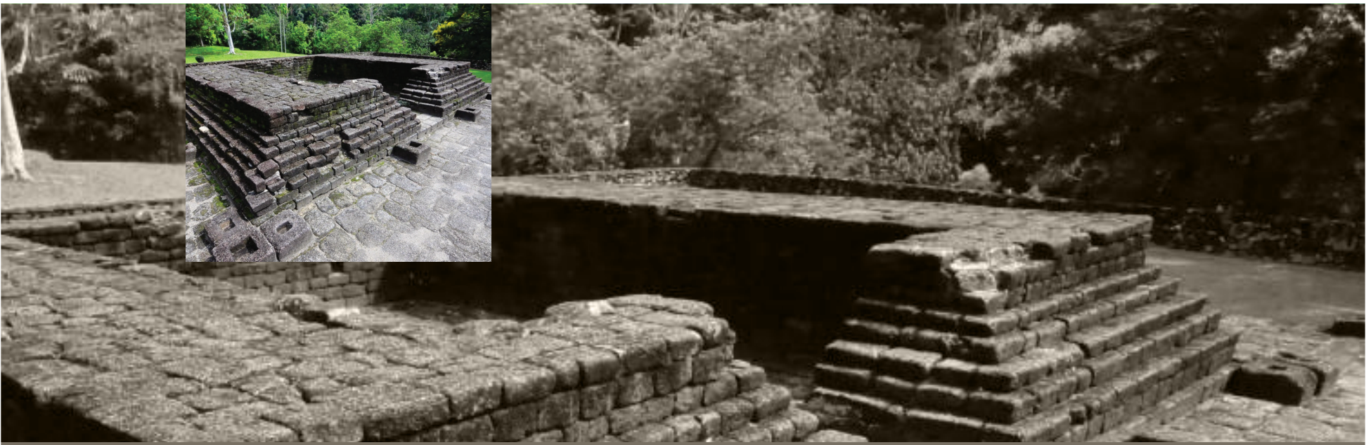
Gambar 1.1: Candi di Lembah Bujang Merbok Kedah

Jika sumber sastra lebih bersifat mitos maka sumber tempatan yang lebih menyakinkan untuk membuktikan hal ini adalah dengan berasaskan penemuan artifak dan penemuan yang penting sekali, iaitu kesan-kesan kewujudan kerajaan pelabuhan di Lembah Bujang. Kerajaan ini dikatakan melalui dua tahap perkembangan, tahap pertama bermula sejak abad ke-5 atau 6 Masihi hingga abad ke-10 yang dikenali sebagai tahap Sungai Mas dan selepasnya abad ke-11 hingga abad ke-14 Masihi yang dikenali sebagai tahap Pangkalan Bujang. Dari segi anutan agama pula, tahap pertama dipengaruhi oleh agama Buddha sedangkan tahap kedua oleh agama Hindu. Perkara inilah yang dilihat menjadi aspek yang paling unik dan menarik dalam sejarah Kedah selain dapat membezakannya dengan negeri-negeri lain di Semenanjung Tanah Melayu.