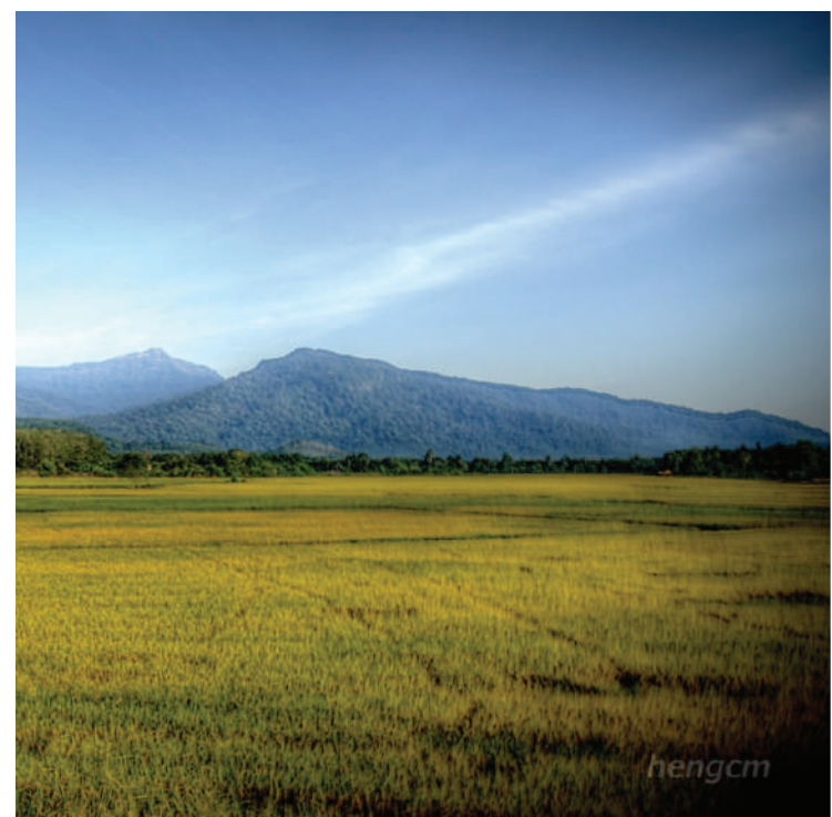
Gambar 1.2: Gunung Jerai

Jika diperhatikan Gunung Jerai dari semua sudut kecuali dari timur, gunung itu kelihatan panjang dan megah. Bentuk ini membenarkan kepercayaan orang-orang Melayu yang mengatakan Gunung tersebut mempunyai empat segi tapaknya. Gunung itu lebih menyerong dari barat laut ke tenggaranya dan tidak berlaku dari timur laut ke barat daya. Di sebelah barat, gunung itu menjulur sampai ke laut. Bahagian lain di kelilingi oleh tanah pamah. Di bahagian utara timur dan selatannya adalah curam. Berlainan sekali dengan keadaannya dengan gunung-gunung yang berbatu geranit yang terdapat di pulau-pulau lain di Semenanjung. Lerengnya dilitupi dengan hutan-hutan manakala lurahnya terlampau curam dan hutannya tebal. Sesetengahnya terdiri daripada batu pejal dan tiada tumbuhan. Terdapat enam curam yang mempunyai air terjun. Selain itu, terdapat hakisan laut di bahagian sebelah pantainya. Berdasarkan ciri-ciri tersebut tidak syak lagi bahawa Gunung Jerai terbentuk daripada batu-batu berlapis yang telah dihimpit oleh gerakan gempa bumi. Pendapat ini berdasarkan teori pembentukan gunung bagi kawasan yang dilanda gempa bumi.