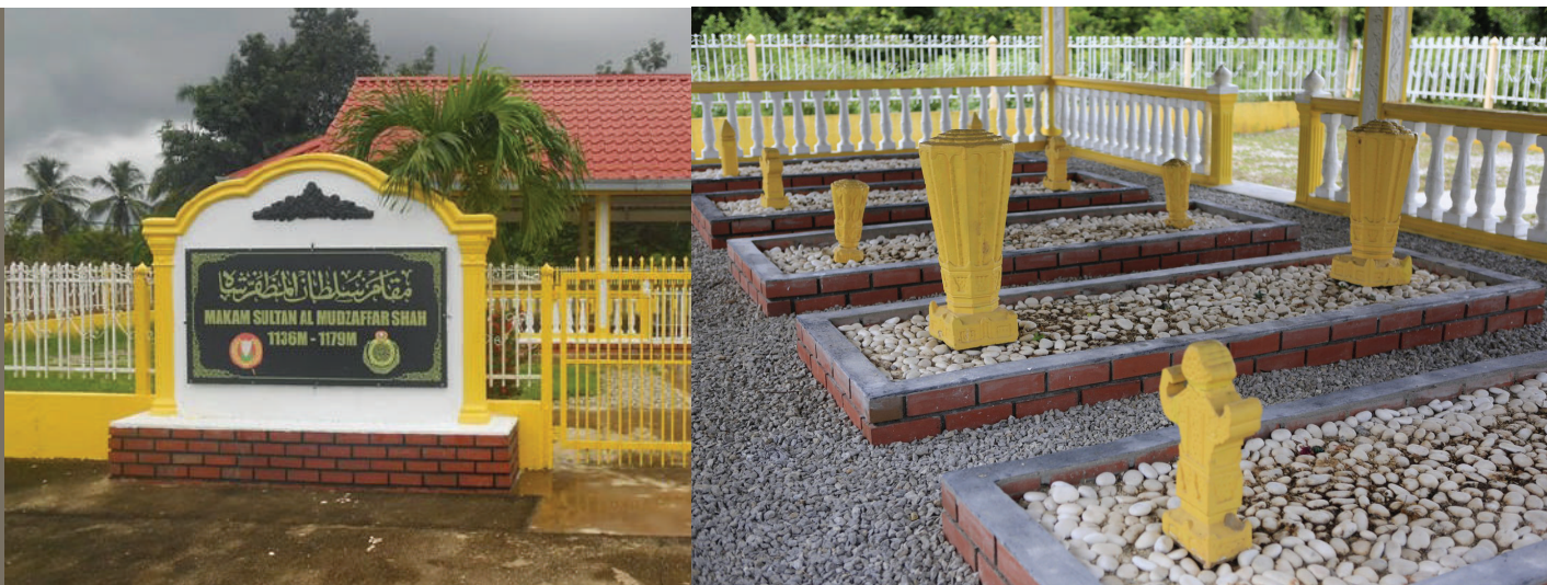
Gambar 1.6: Makam Sultan Muzaffar Shah dan kaum kerabatnya

Sultan Muzaffar Shah I adalah Sultan Kedah yang mula-mula beragama Islam. Baginda mempunyai tiga orang putera dan masing-masing putera baginda itu diberikan jawatan, iaitu Tunku Muaz-zam memerintah di Kota Palas dalam Mukim Tepus di daerah Kubang Pasu sekarang manakala Tunku Sulaiman digelar Raja Laksamana memerintah Pulau Langkawi dan pulau-pulau lain sehingga ke Kuala Prai. Akhir sekali Tunku Mahmud yang digelar Raja Muda memerintah mukim Padang Terap. Setelah memerintah Kedah selama lebih kurang empat puluh tiga tahun, pada tahun 1179 bersamaan dengan tahun 575 H, Sultan Muzaffar Shah pun mangkat di istana baginda di Bukit Meriam. Jenazah al-marhum telah dimakamkan di Pangkalan Langgar di Lembah Bujang berhampiran Gunung Jerai.