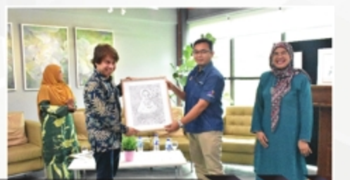
PERASMIAN DAN PENUTUP PAMERAN SENI 'CETUSAN SENI JIWA SRIKANDI' FSSR UITM CAWANGAN MELAKA PERPUSTAKAAN UITM CAWANGAN MELAKA - 29 NOVEMBER 2018