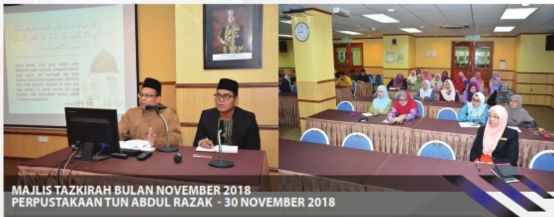
MAJLIS TAZKIRAH BULAN NOVEMBER 2018 PERPUSTAKAAN TUN ABDUL RAZAK - 30 NOVEMBER 2018