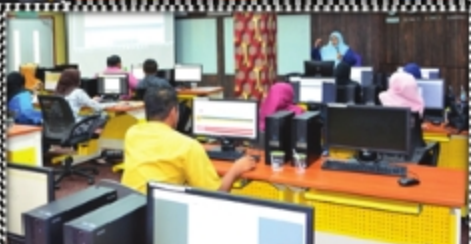
PERKONGSIAN ILMU PERPUSTAKAAN 2018 PERPUSTAKAAN UITM CAWANGAN JOHOR - 7 NOVEMBER 2018