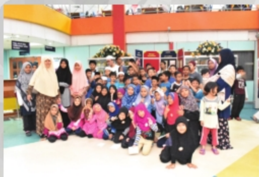
SMK GHAFAR BABA & SMK SULTAN ALAUDDIN TARIKH: 29 NOVEMBER 2018 TEMPAT: PERPUSTAKAAN UITM CAWANGAN MELAKA