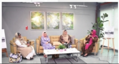
PROGRAM BICARA SENI: CABARAN PELUKIS & PEREKA WANITA MALAYSIA ABAD KE 21 PERPUSTAKAAN UITM CAWANGAN MELAKA - 22 NOVEMBER 2018