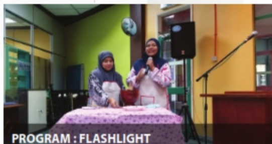
PROGRAM : FLASHLIGHT PERPUSTAKAAN DATO' JAAFAR HASSAN CAWANGAN PERLIS - 2 NOVEMBER 2018