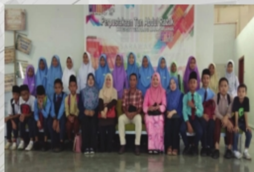
LAWATAN SEKOLAH SK PINANG TARIKH: 13 NOVEMBER 2018 TEMPAT: PERPUSTAKAAN TUN ABDUL RAZAK UITM CAWANGAN SARAWAK KAMPUS SAMARAHAN