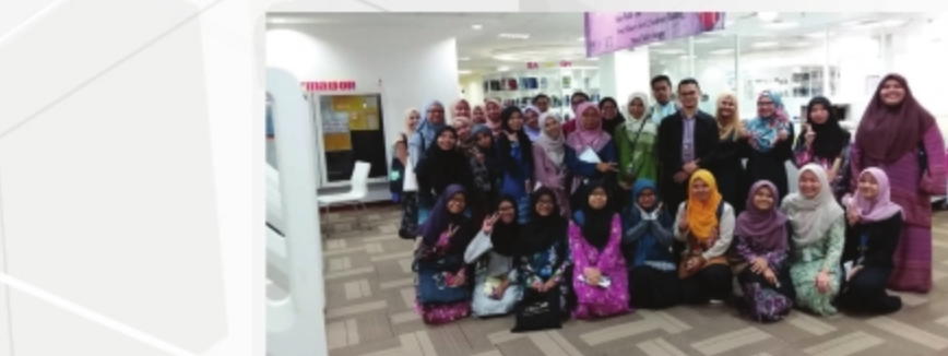
LAWATAN DARIPADA PELAJAR SEMESTER 3, FAKULTI PENGAJIAN MAKLUMAT, UITM PERPUSTAKAAN UITM KAMPUS SG BULOH - 26 NOVEMBER 2018