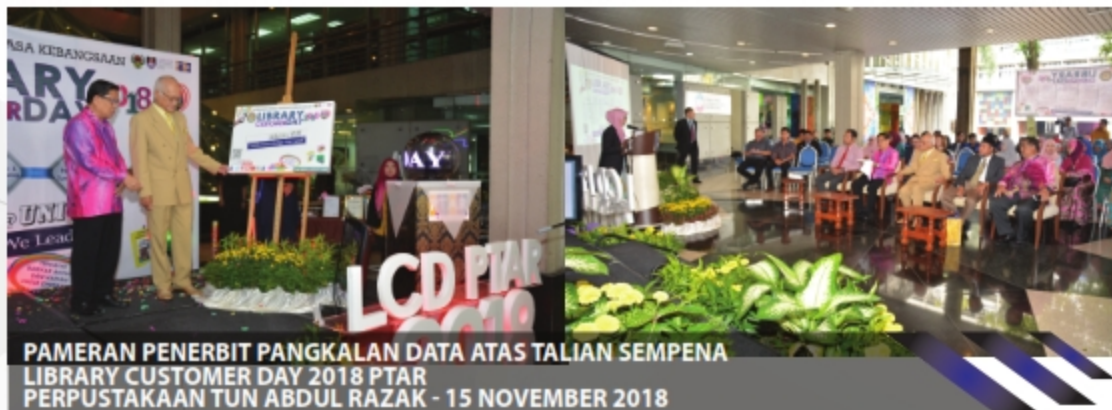
PAMERAN PENERBIT PANGKALAN DATA ATAS TALIAN SEMPERA LIBRARY CUSTOMER DAY 2018 PTAR PERPUSTAKAAN TUN ABDUL RAZAK - 15 NOVEMBER 2018