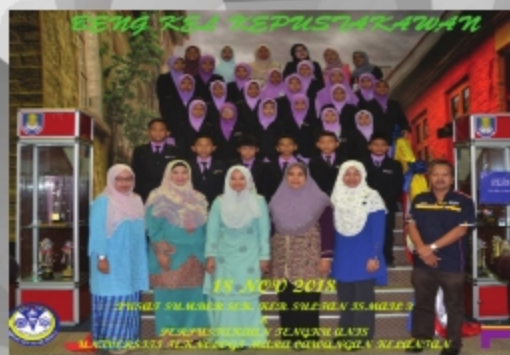
SK SULTAN ISMAIL 3, KOTA BHARU KELANTAN TARIKH: 19 NOVEMBER 2018 TEMPAT: PERPUSTAKAAN TENGGU ANIS, UITM CAWANGAN KELANTAN