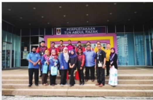
LAWATAN DARIPADA POLITEKNIK NILAI, NEGERI SEMBILAN PERPUSTAKAAN UITM CAWANGAN PULAU PINANG - 15 NOVEMBER 2018