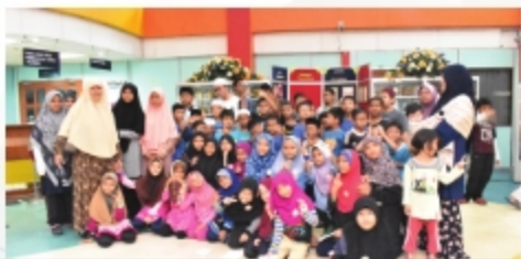
LAWATAN PELAJAR PROGRAM KEM HUFFAZ CILIK PERPUSTAKAAN UITM CAWANGAN MELAKA - 29 NOVEMBER 2018