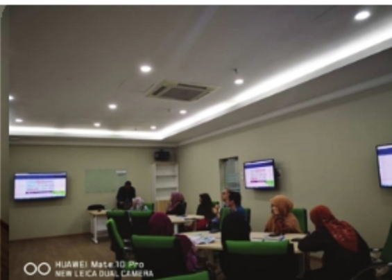
JERAYAWARA AKADEMI PENGAJIAN BAHASA PERPUSTAKAAN UITM CAWANGAN PULAU PINANG - 12 NOVEMBER 2018