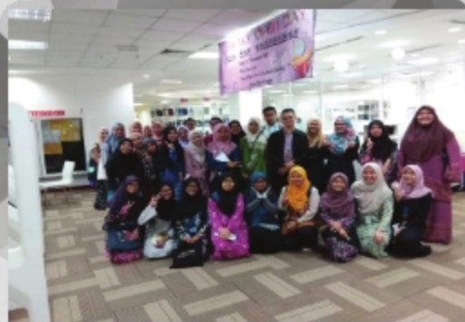
FAKULTI PENGAJIAN MAKLUMAT, UITM PUNCAK PERDANA TARIKH: 26 NOVEMBER 2018 TEMPAT: PTAR, UITM KAMPUS SUNGAI BULOH, SELANGOR.