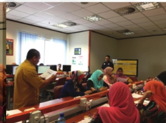
BENKEL PENGENALPASTIAN DAN PENGURUSAN BAHAYA (HIRARC) PERPUSTAKAAN UITM CAWANGAN PULAU PINANG - 7 HINGGA 8 NOVEMBER 2018