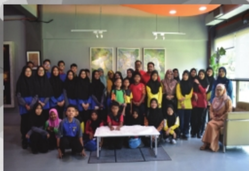
SEKOLAH SBPI SELANDAR, SMK SELANDAR DAN SK BATANG MELAKA TARIKH: 18 NOVEMBER 2018 TEMPAT: PERPUSTAKAAN UITM CAWANGAN MELAKA