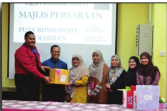
JASAMU DI KENANG, BUDIMU DISANJUNG PERPUSTAKAAN UITM CAWANGAN JOHOR - 5 NOVEMBER 2018