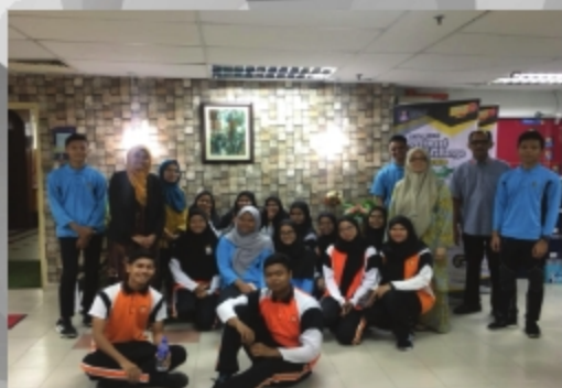
SMK GHAFAR BABA & SMK SULTAN ALAUDDIN SEMPERA PROGRAM SELANGKAH KE UITM TARIKH: 22 NOVEMBER 2018 TEMPAT: PUSAT SUMBER UITM CAWANGAN MELAKA, KAMPUS BANDARAYA