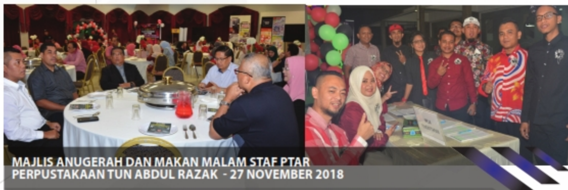
MAJLIS ANUGERAH DAN MAKAN MALAM STAF PTAR PERPUSTAKAAN TUN ABDUL RAZAK - 27 NOVEMBER 2018