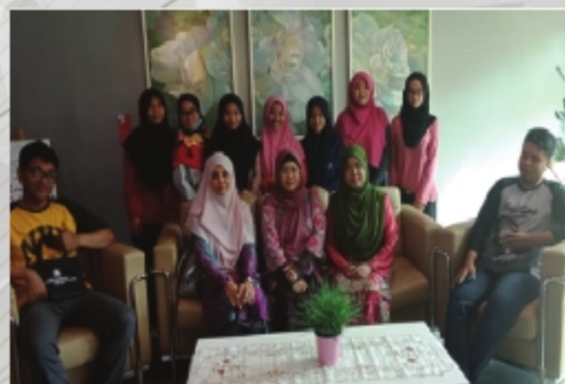
UIN MAULANA MALIK IBRAHIM MALANG, INDONESIA TARIKH: 26 NOVEMBER 2018 TEMPAT: PERPUSTAKAAN UITM CAWANGAN MELAKA