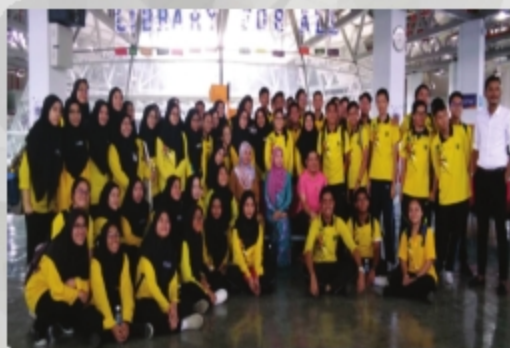
SEKOLAH KOLEJ DATU PATINGGI ABANG HAJI ABDILLAH TARIKH: 22 NOVEMBER 2018 TEMPAT: PERPUSTAKAAN TUN ABDUL RAZAK UITM CAWANGAN SARAWAK KAMPUS SAMARAHAN