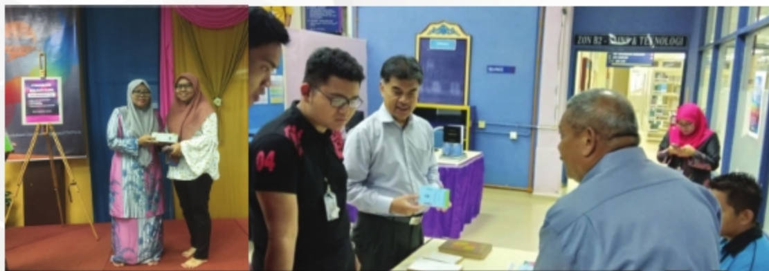
HARI MESRA PDJH 2018 PERPUSTAKAAN DATO' JAAFAR HASSAN CAWANGAN PERLIS - 27 & 28 NOVEMBER 2018