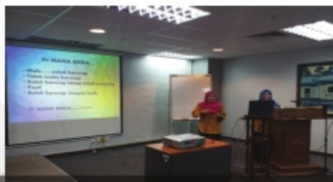
BENKEL LITERASI MAKLUMAT UNTUK STAF PELAKSANA PERPUSTAKAAN UITM PERPUSTAKAAN UITM CAWANGAN MELAKA - 21 NOVEMBER 2018