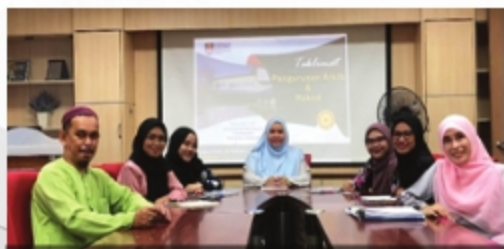
KAJIAN PENGURUSAN DAN PELUPUSAN REKOD PERPUSTAKAAN AL-BUKHARI CAWANGAN PAHANG - 16 NOVEMBER 2018