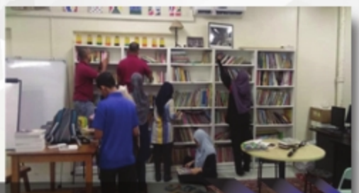
PROGRAM KHIDMAT BANTU : BUKU JALANAN CHOW KIT FASA 1 PERPUSTAKAAN AL-BUKHARI UITM CAWANGAN PAHANG - 16 NOVEMBER 2018