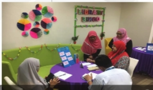
HARI TERBUKA PERPUSTAKAAN 2018 PERPUSTAKAAN UITM KAMPUS SG BULOH - 28 HINGGA 29 NOVEMBER 2018