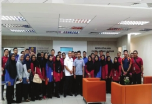
POLITEKNIK LANGKAWI TARIKH: 7 SEPTEMBER 2018 TEMPAT: PERPUSTAKAAN DATO JAAFAR HASSAN, UITM CAWANGAN PERLIS