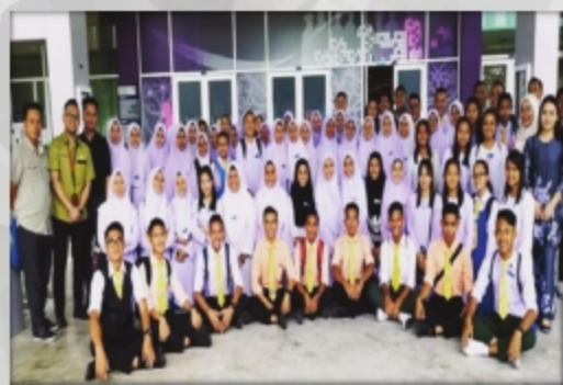
SMK GEDONG TARIKH: 19 SEPTEMBER 2018 TEMPAT: PTAR SAMARAHAN 2, UITM CAWANGAN SARAWAK