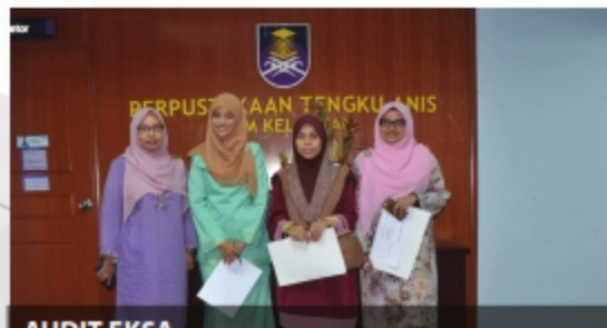
AUDIT EKSA PERPUSTAKAAN TENGKU ANIS - 25 SEPTEMBER 2018