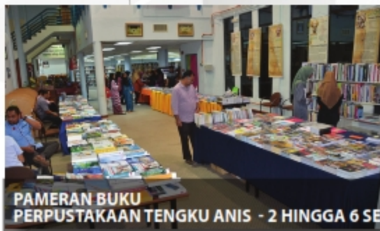
PAMERAN BUKU PERPUSTAKAAN TENGKU ANIS - 2 HINGGA 6 SEPTEMBER 2018