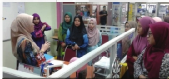
'LIBRARY TOUR' BERSAMA PELAJAR PRA-DIPLOMA UITM CAWANGAN TERENGGANU - 2 SEPTEMBER 2018