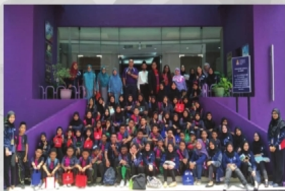
SEKOLAH KEBANGSAAN SEBATU SUNGAI RAMBAI, MELAKA TARIKH : 26 SEPTEMBER 2018 TEMPAT: PUSAT SUMBER UITM CAWANGAN MELAKA KAMPUS BANDARAYA PADA