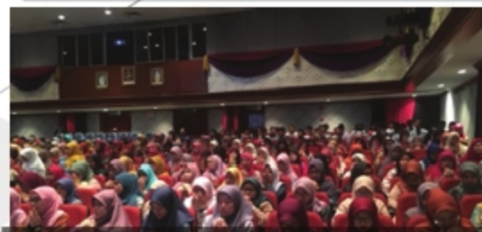
TAKLIMAT PERPUSTAKAAN MINGGU DESTINI SISWA (MDS) & MINGGU PEMANTAPAN SISWA (MPS) UITM CAWANGAN MELAKA - 03 SEPTEMBER 2018