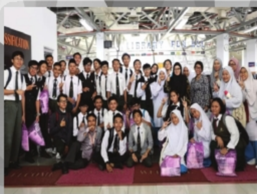
SMK TABUAN JAYA TARIKH: 13 SEPTEMBER 2018 TEMPAT: PTAR CAWANGAN SARAWAK