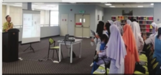
TAKLIMAT PERPUSTAKAAN PTAR KAMPUS SAMARAHAN RIVERSIDE MAJESTIC HOTEL, SARAWAK - 8 SEPTEMBER 2018