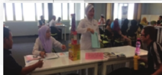
SARINGAN KESIHATAN DAN CERAMAH KESIHATAN PERPUSTAKAAN TUN ABDUL RAZAN SAMARAHAN 2 - 26 SEPTEMBER 2018