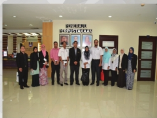
LAWATAN PENANDAARASAN UNIVERSITI PETRONAS, PERAK TARIKH: 28 SEPTEMBER 2018 TEMPAT: PTAR UTAMA