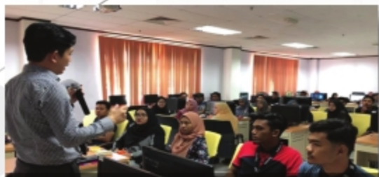
"EIKON & DATASTREAM ONLINE DATABASE TRAINING" PERPUSTAKAAN AL-BUKHARI, UITM CAWANGAN PAHANG - 20 SEPTEMBER 2018