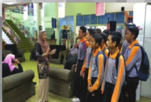
SMK TAMAN RIA TARIKH: 7 SEPTEMBER 2018 TEMPAT: PERPUSTAKAAN SULTAN BADLISHAH, UITM CAWANGAN KEDAH