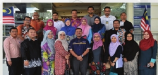
SESI AUDIT EXTERNAL REVIEW (ER) INOKA DAN AUDIT UITM CAWANGAN KEDAH - 18 HINGGA 20 SEPTEMBER 2018