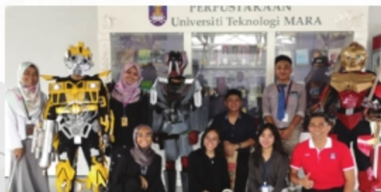
SEKITAR UJICUBA HASIL CIPTAAN PELAJAR KE PTAR KAMPUS SAMARAHAN PERPUSTAKAAN TUN ABDUL RAZAK KAMPUS SAMARAHAN - 24 SEPTEMBER 2018