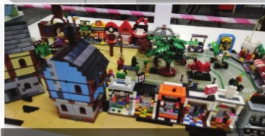
PERTANDINGAN LEGO 'BUILD IT' PERPUSTAKAAN UITM CAWANGAN MELAKA KAMPUS JASIN - 27 HINGGA 28 SEPTEMBER 2018