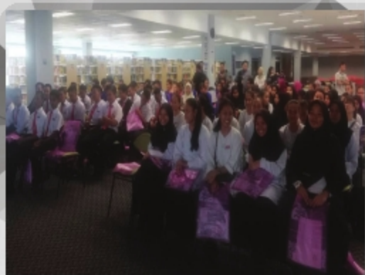
SMK OYA TARIKH: 13 SEPTEMBER 2018 TEMPAT: PTAR CAWANGAN SARAWAK