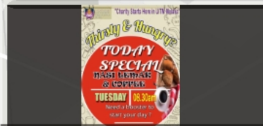
PROGRAM MINUM PAGI PERCUMA @PERPUSTAKAAN KEMBALI LAGI PERPUSTAKAAN UITM CAWANGAN MELAKA KAMPUS JASIN - 13 SEPTEMBER 2018