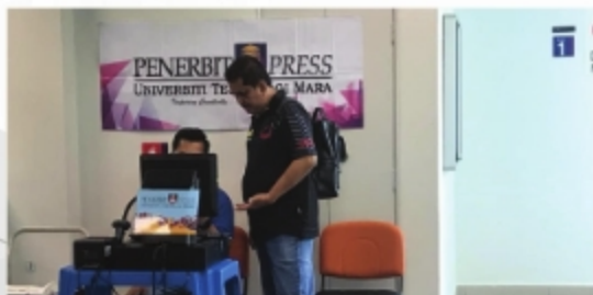
PAMERAN BUKU DARI UITM PRESS PERPUSTAKAAN UITM CAWANGAN MELAKA KAMPUS JASIN - 19 HINGGA 20 SEPTEMBER 2018