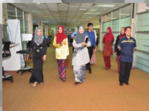
LAWATAN KE PERPUSTAKAAN TUN ABDUL RAZAK BAGI PROGRAM PEMANTAUAN UNIVERSITI AIMS MALAYSIA TARIKH: 26 SEPTEMBER 2018 TEMPAT: PTAR UTAMA