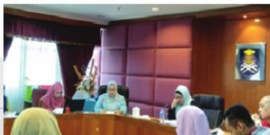
MESYUARAT JAWATANKUASA PERPUSTAKAAN UITM NEGERI (JPPN) BIL 1/2018 KAMPUS BANDARAYA MELAKA, UITM CAWANGAN MELAKA - 28 SEPTEMBER 2018