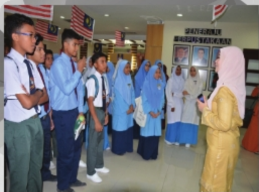
SEKOLAH MEN. KEB.SULTAN ABDUL SAMAD, KLANG SELANGOR TARIKH: 6 SEPTEMBER 2018 TEMPAT: PTAR UTAMA