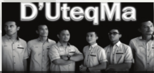
TAHNIAH ATAS KEMENANGAN DI FESTIVAL NASYID PERINGKAT NEGERI SARAWAK LAWAS. SARAWAK - 29 SEPTEMBER 2018