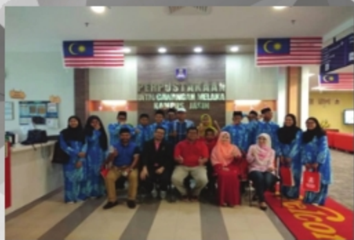
ASRAMA KASIH TARIKH: 1 SEPTEMBER 2018 TEMPAT: PERPUSTAKAAN KAMPUS JASIN, UITM CAWANGAN MELAKA