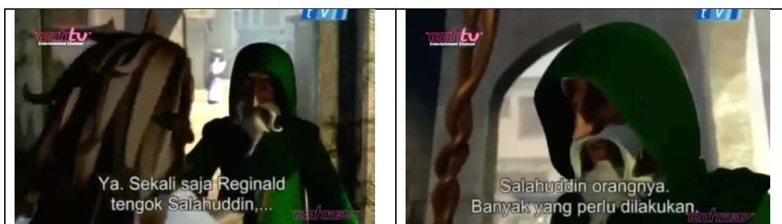
Frame 6 dan 7. Watak eksistensi: Omar dalam Saladin the Animated Series

Terjemahan kepada petikan di atas, Salahuddin atau dalam biografinya ditulis sebagai Salah ed-Din sangat suka mendengar pembacaan al-Quran, dan sering berdebat dengan Imam kerana Salahuddin menguasai ilmu berkaitan dengan al-Quran, menghafaz serta memahaminya dengan mendalam. Salahuddin akan berjalan daripada khemah ke khemah pada malam hari dan meminta mana-mana askar untuk membaca beberapa surah. Seterusnya, Salahuddin akan memulakan ceramahnya dengan membaca 20 ayat daripada surah tertentu, atau lebih, atau dibaca oleh orang yang dilantik untuk membacanya. Pihak produksi telah membuatkan watak eksistensi Omar menentang kehidupan sebenar Salahuddin al-Ayubi dengan menjadikannya bersahabat dengan peramal dan mempercayai kepada peramal.