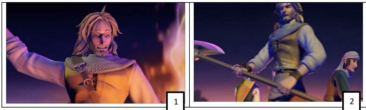
Frame 4 dan 5. Watak eksistensi Duncan dalam Saladin the Animated Series

Seterusnya, antara eksistensi yang dilakukan oleh pihak penerbit ialah watak Duncan. Kehadiran watak Duncan adalah amat mengelirukan kerana dia ialah bekas tentera Salib atau dalam siri animasi ini dikenali sebagai tentera Reginald, dan bekas tentera Salib ini telah disatukan dengan pemimpin tentera Islam yang mengeluarkan tentera Salib dari bumi Mesir. Dalam Saladin the Animated Series , selain Tarik, Duncan juga merupakan teman rapat Saladin, dan perkenalan mereka bermula sewaktu penangkapan Saladin untuk dijadikan hamba. Duncan menyelamatkan Saladin sewaktu melarikan diri dari penjara Behram (siri kedua: Marauders ). Pihak produksi telah menjadikan watak Duncan lebih terserlah berbanding Saladin. Duncan ialah watak yang sentiasa ada bersama Saladin, dan sentiasa melindungi Saladin. Watak ini juga diwujudkan bagi melampaui watak utama, dengan berperwatakan seperti seorang hero.