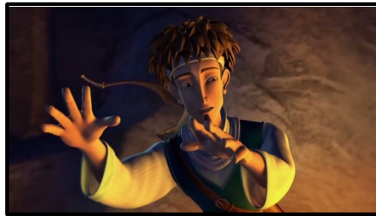
Frame 3. Watak eksistensi: Tarik, Saladin the Animated Series

dengan perwatakan gemar membuat jenaka, penakut, dan sentiasa menghalangi Saladin daripada mencuba perkara baharu kerana ditakuti Saladin akan berbuat silap sebagaimana watak sokongan dalam animasi Disney.