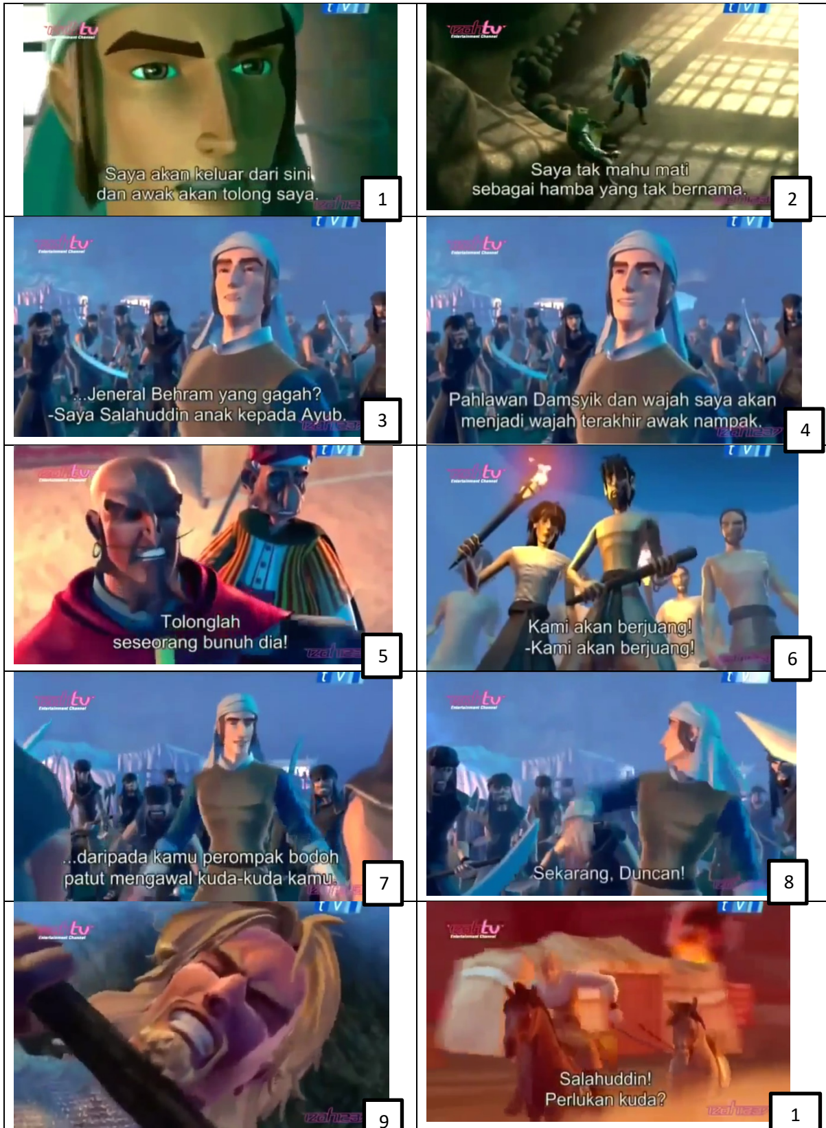
Frame berturutan 2. Saladin meminta Duncan untuk menolongnya untuk melarikan diri daripada penjara Jeneral Behram.

(42:54-47:05 di Animated_Stories_of_Islam.nashbooky.com.mp4 )