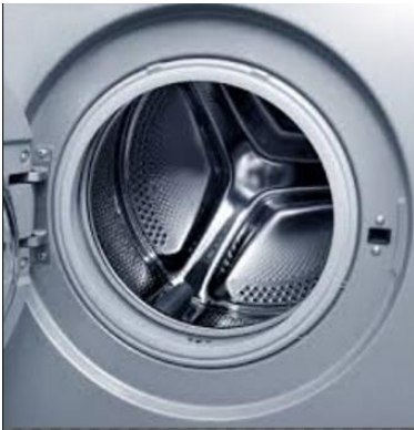
The inner drum of front loader washing machine