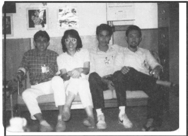
Bergambar bersama Mentee selepas pertemuan Mentor – Mentee (1987).