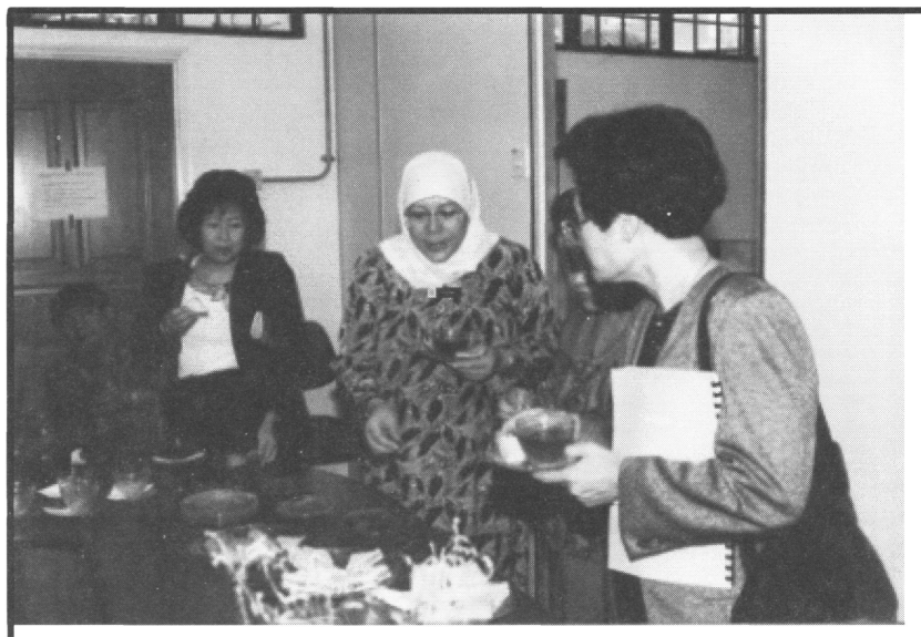
Bergambar bersama – sama para pustakawan dari Thailand Librarians Association yang melawat Kajian Sains Perpustakaan, ITM (1994).