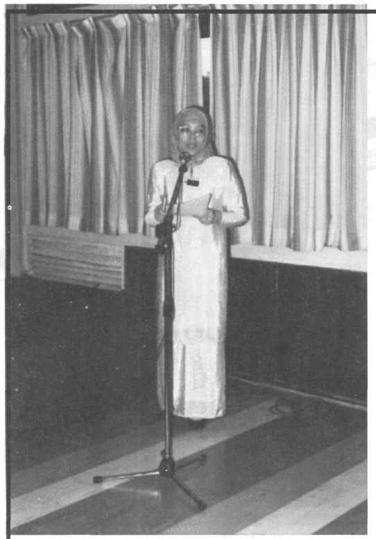
Sebagai dekan sewaktu memberi ucapan perasmian kegiatan akademik di Kajian Sains Perpustakaan, ITM, Jalan Othman, Petaling Jaya (1992).